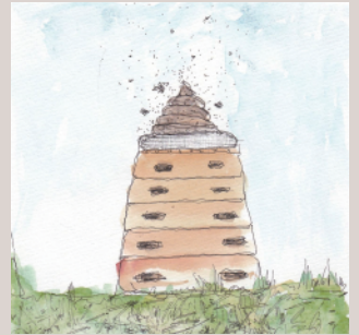
《跳び箱の上のうんうん》