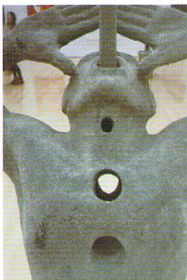
水面に声を届ける / 2008