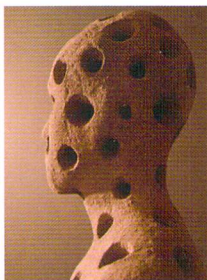
海を想う / 2008