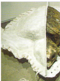
浜で送る / 2006