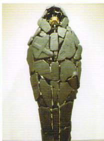
再生を待つために / 2005