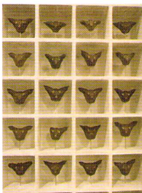
千顔千顔 / 2004