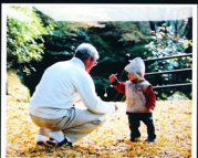
優秀賞：「秋とふれあう」

今展覧会は、毎年温知会が主催する塩江町をテーマとしたフォトコンテストで入賞した作品を展示し紹介します。今回は、特別に過去の優秀作品も併せて展示します。