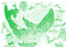
「でんでんたいご命」