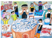
「魚屋さんを見たよ」