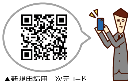
▲新規申請用二次元コード

高松市ホームページ内のリンク又は下記の二次元コードを読み取りのうえ、必要項目を御入力ください。※書面による申請と重複しないよう御注意ください。