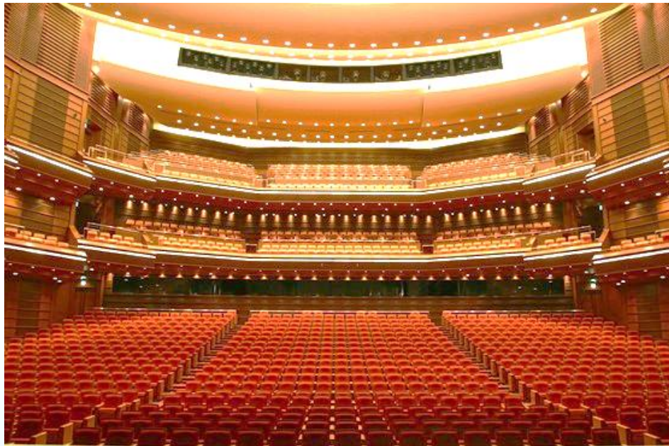
<文化芸術ホール 大ホール>