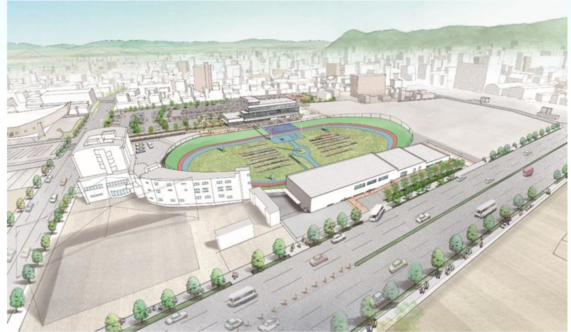
(施設整備イメージ)

高松競輪場再整備事業における事業管理及び競輪場維持管理並びに運営に係る業務それぞれの契約で定める各年度の競輪開催業務等委託料の合計額