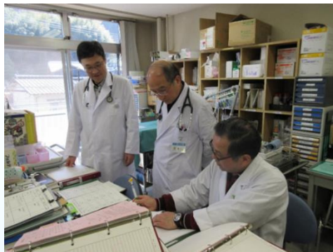
すでに開設している香川大学寄附講座の様子