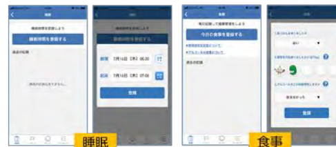
<アプリのイメージ>