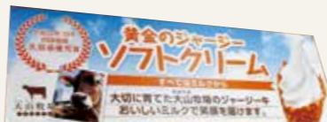
食後は産直カフェいち押しのソフトクリームで決まり！