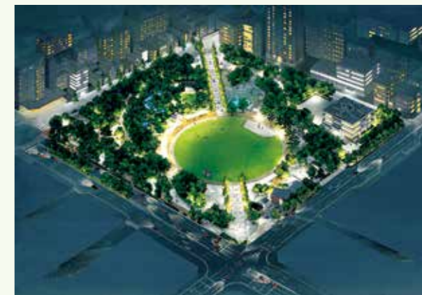
イメージパース(夜間景観)