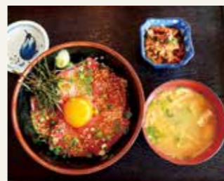
人気メニュー「ハマチづげ丼」とお好みの小鉢を合わせて