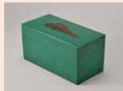
山下義人「山滴る」蒔器箱 2014年