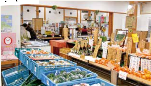
毎朝、地元の農家が持ってくる新鮮な生鮮食品がそろった産直市場