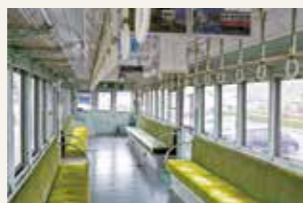
電車の中も見学できます