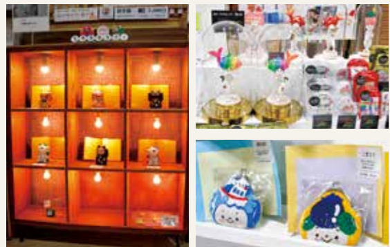
地元で活躍する作家の作品も展示、販売されています。