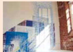
石田尚志「REFLECTION」2009年 ©Takashi Ishida

・展示室1「うつしとる—光・時間・情報・動き」 ・展示室2「讃岐漆芸が見せる自然美」 ■会期／4月6日(土)～7月7日(日) ■料金／一般200円、大学生150円、65歳以上・高校生以下無料