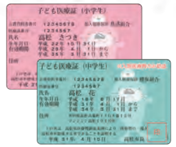
【3月末までの医療証】

3月末時点で有効な高松市子ども医療証を持っている人には、3月下旬に新しい医療証を郵送します。それ以外の対象者(現在中学生など)は申請が必要です。3月下旬に申請書類を郵送します。