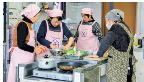
高松市食生活改善推進協議会 (一宮ブロック：檀紙地区)

檀紙地区では、地区の文化祭や町民祭りで食バザーを提供したり、防災訓練参加者へ豚汁を提供するなど、地域の人と交流しながら活動をしています。また年に1回、約100人の高齢者への配食サービスも行っています。