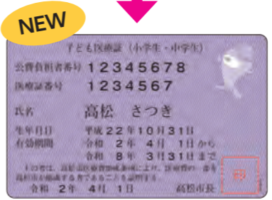
【4月からの新しい医療証】

乳幼児 現在持っている子ども医療証(乳幼児)は記載内容に変更がない場合、有効期間の終わりまでそのまま使えます。