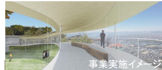
事業実施イメージ