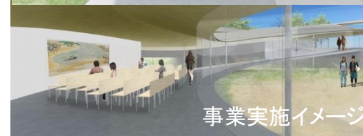
事業実施イメージ