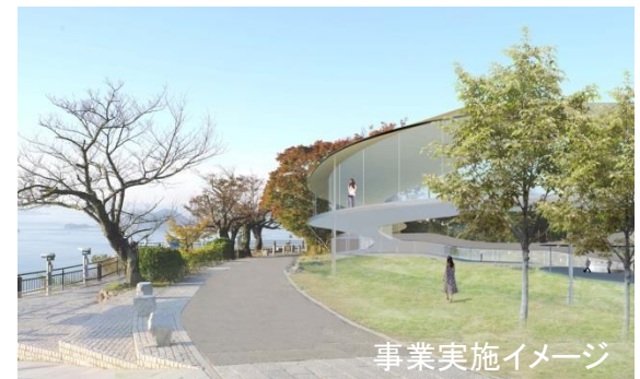
事業実施イメージ