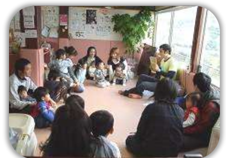
高松市がNPOに委託している 子育て支援事業（つどいの広場）

そのため、市民活動団体には、多様なサービスの供給や政策提言、地域コミュニティ協議会と協働してコミュニティ再生に取り組むなどの社会的役割を担うことが期待されています。