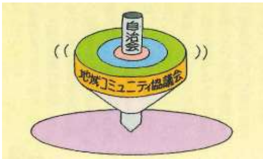
【自治会と地域コミュニティ協議会の関係】

地域コミュニティ協議会は、すべての構成員がお互いを尊重し、力を合わせ、地域の課題を発見・認識し、解決に向けて取り組みます。また、地域によっては、特性を生かしたコミュニティビジネスを行うなど、地域の価値を創造していく役割も担う、地域再生に不可欠な組織です。