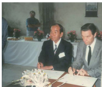
トゥール市と姉妹都市提携