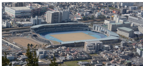
屋島レクザムフィールド

平成29年 屋島競技場（愛称：屋島レクザムフィールド）が リニューアルオープン 台湾の基隆市と交流協定締結 台湾の基隆市と交流協定締結 有料道路であった屋島ドライブウェイが無料化