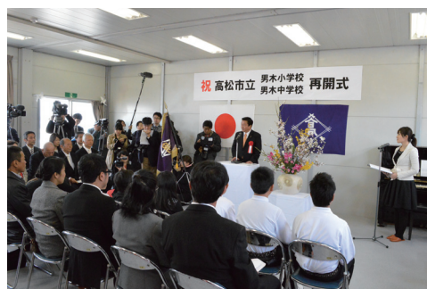
男木小・中学校再開式