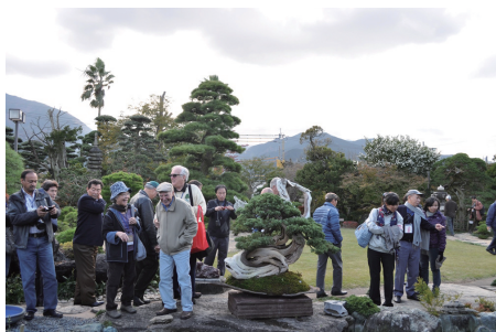
アジア太平洋盆栽水石高松大会