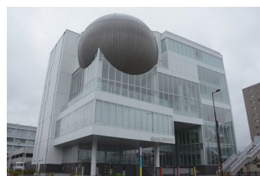
たかまつミライエ

平成29年 屋島競技場（愛称：屋島レクザムフィールド）が リニューアルオープン 台湾の基隆市と交流協定締結 台湾の基隆市と交流協定締結 有料道路であった屋島ドライブウェイが無料化