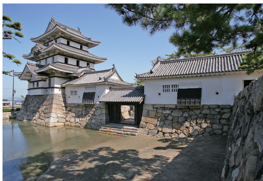
国指定重要文化財 「高松城 北之丸見櫓・渡櫓・水手御門」