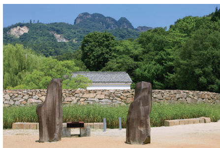
イサム・ノグチ庭園美術館