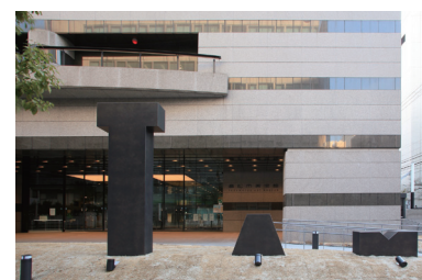
市美術館リニューアル後

平成27年 コトデン瓦町ビルに瓦町FLAGが開業 高松市美術館リニューアルオープン