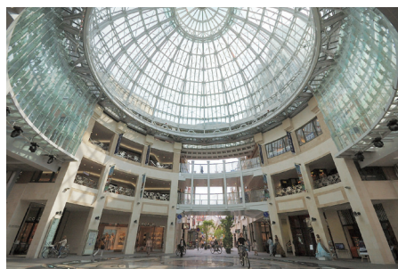
高松丸亀町壱番街