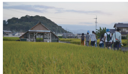
パラダイス仏生山