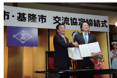
基隆市（台湾）と交流協定締結