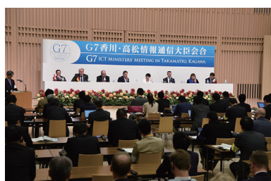
G7香川・高松情報通信大臣会合