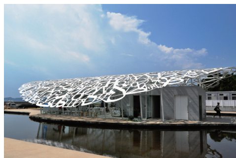
男木交流館 ジャウメ・プレンス「男木島の魂」