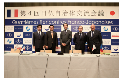
第4回日仏自治体交流会議

平成26年 「第3回高松国際ピアノコンクール」の開催 「第4回日仏自治体交流会議」の開催 ・過去最高となる45自治体の首長ら約160名が参加