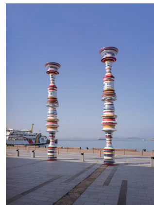
瀬戸内国際芸術祭 大巻伸嗣「Liminal Air -core-」