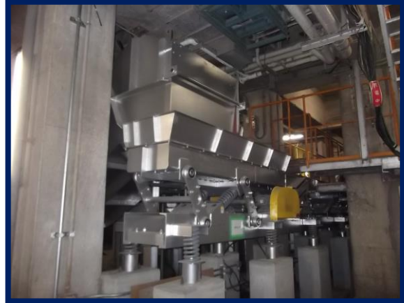
2号灰コンベア(改修後)