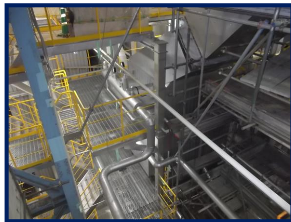
2号炉集じん器(改修後)