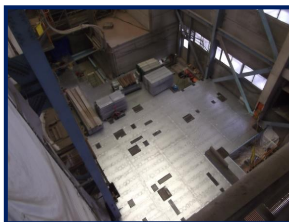
2号炉集じん器撤去後