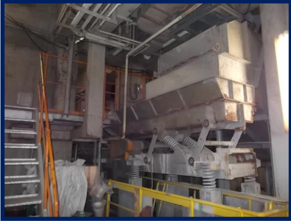
1号灰コンベア(改修前)