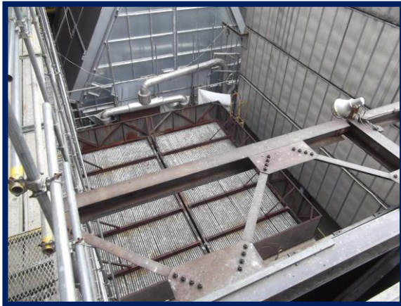
蒸気復水器(改修前)