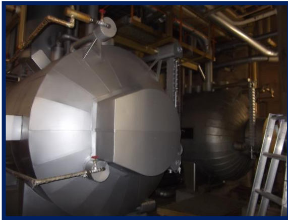
脱気器(改修後:手前、改修前:奥)