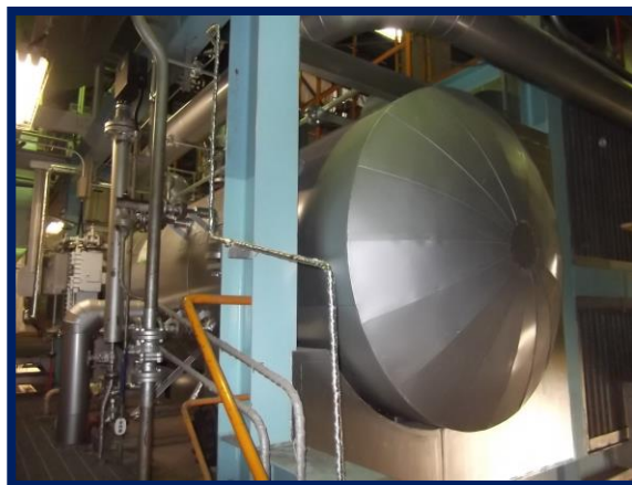
2号炉ボイラ(改修後)