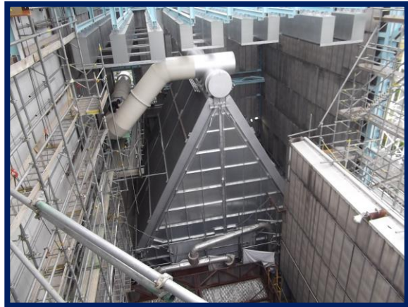
蒸気復水器(改修後)

送風機等の電動機をインバーター化及び高効率電動機へ更新し、消費電力の削減を図っております。