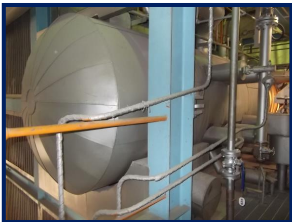
1号炉ボイラ(改修前)

2号炉系統の改修工事を行いました。平成29年6月からは、1号炉系統の改修工事に着手します。