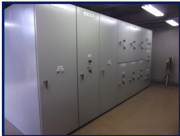
高圧受電設備(改修後)