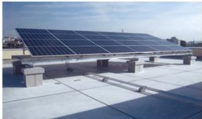
太陽光発電設備（牟礼支所・コミュニティセンター）