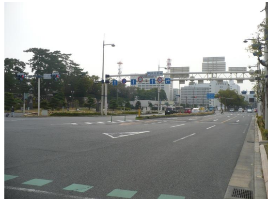
都市軸沿道（11・193号等）景観形成重点地区