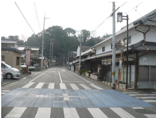
仏生山歴史街道景観形成重点地区