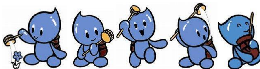
高松市節水キャラクター「タメット」

* 用途地域内を始めとする歩道部において、透水性舗装を整備した面積の累計を示します。