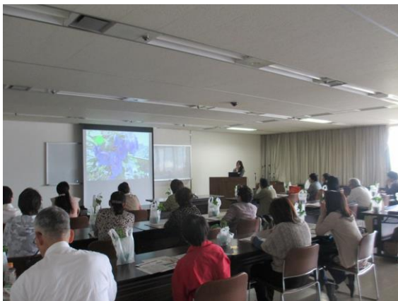
環境保全推進課分室（旧環境プラザ）での環境学習