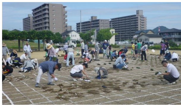
芝生植栽 市民との協働作業