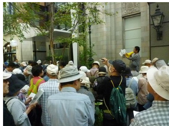
文化財学習会（ふるさと探訪）