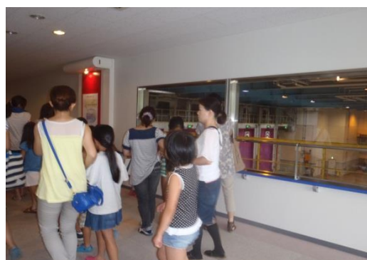
南部クリーンセンター（エコホテル）施設見学