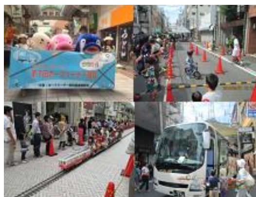
カーフリーデー高松開催の様子