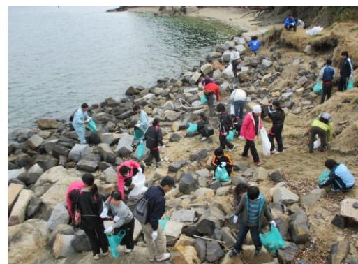
屋島クリーン大作戦