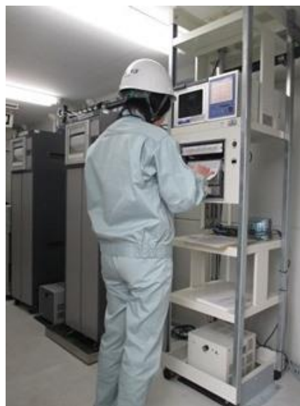
大気測定局での点検風景（東部運動公園測定局）