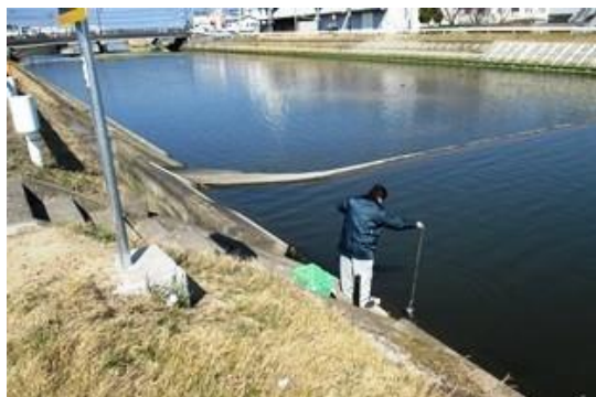
河川での水質調査

*2 行政人口に対する、下水道整備区域内人口及び下水道整備区域外における合併処理浄化槽とコミュニティプラントと農業集落排水の利用人口の割合を示します。