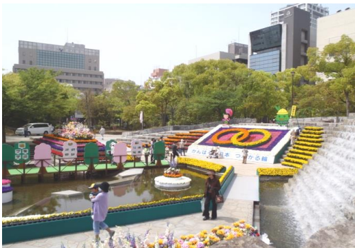
春のフラワーフェスティバル