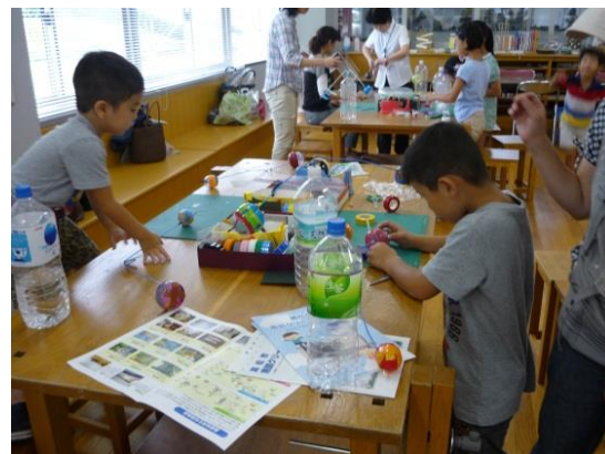
南部クリーンセンター（エコホテル）親子工作会