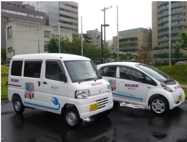
電気自動車（高松市役所公用車）