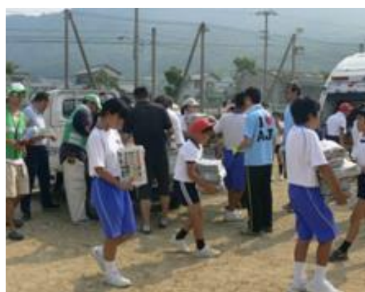
庵治中学校の取組「みんなでリサイクル運動」