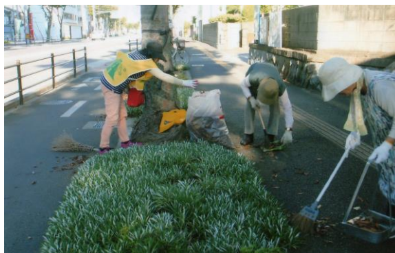
たかまつマイロードの活動