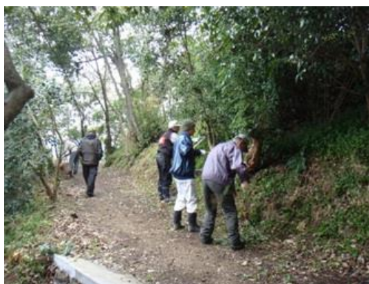
まぐさ山清掃活動