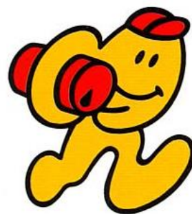
ごみ減量・資源化シンボルキャラクター 「カンクルちゃん」