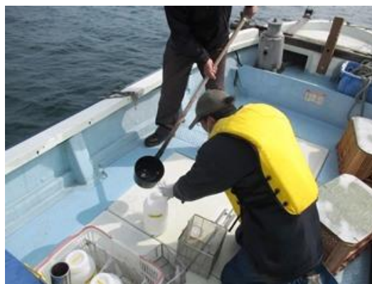
海域での水質調査