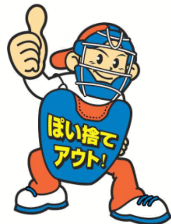
環境美化シンボルキャラクター「アウトくん」

また、学校教育の場では、ごみの分別やごみ処理施設の見学など、体験型の環境啓発学習を積極的に行い、不法投棄やポイ捨てのないまちを目指し、自分たちの地域は自分たちで守るというという環境意識の向上に取り組みます。