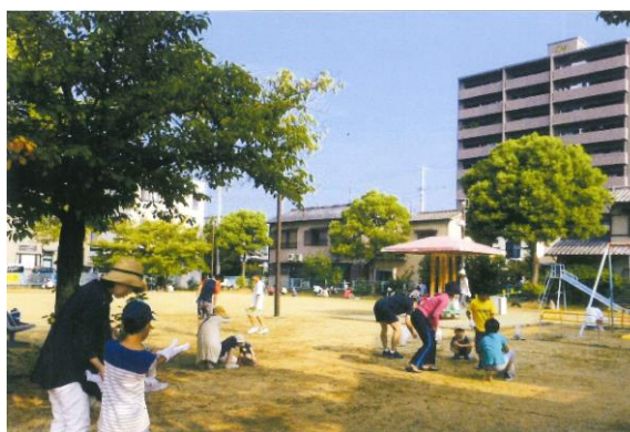
公園愛護会の活動