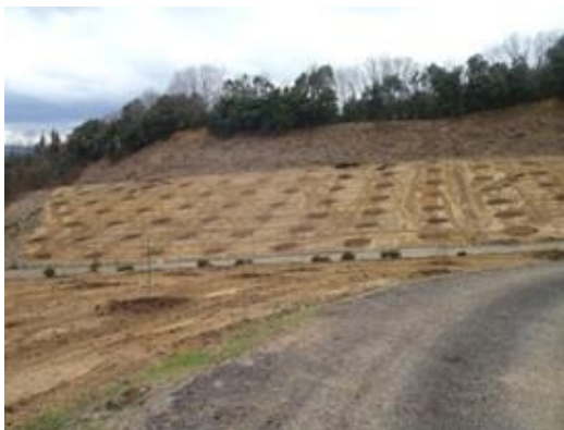
耕作放棄地の活用（オリーブ苗木を植樹）