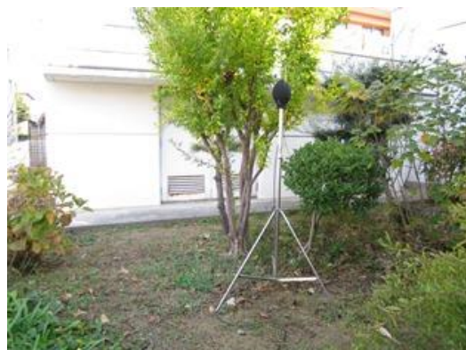
一般地域の環境騒音測定風景（屋島西コミュニティセンター）