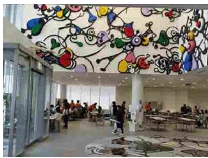
こども未来館わくわく体験事業