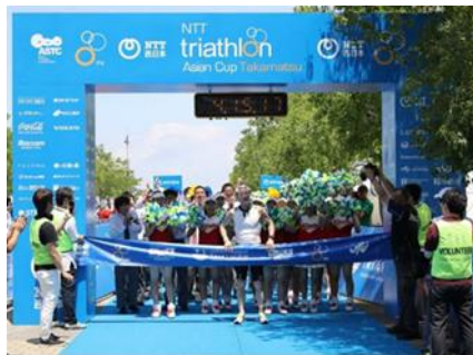
サンポート高松 トライアスロン大会開催事業