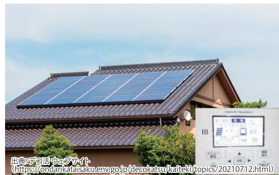
ネット・ゼロ・エネルギー・ハウス (ZEH)