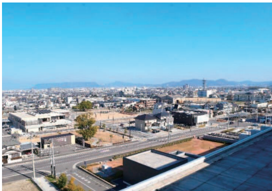
香川県農業試験場跡地北側エリアの 計画的な土地利用

地図に関連する行政手続の効率化や民間事業者が保有する地図に関連する情報の活用による新たなサービスの創出を図るため、官民の保有する地図情報のデジタル化・オープンデータ化に取り組みます。