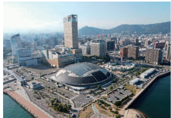
都市機能の充実と集積促進