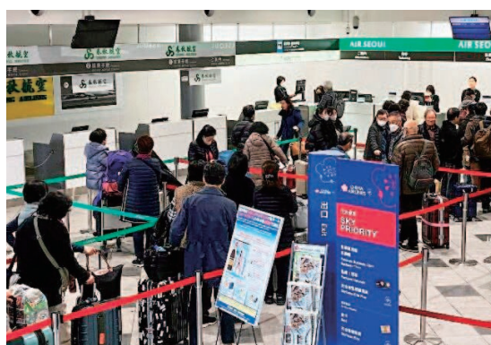
高松空港国際線チェックインカウンター

四国の新幹線の早期実現に向け、香川県市町長四国新幹線整備促進期成会と連携しながら、課題等を検討し、また、四国新幹線整備促進期成会を中心に、国や四国四県と連携を図りながら、民間企業や経済界等の関係者と一体となって、具体的な調査・検討を行い、市民意識の醸成に取り組みます。