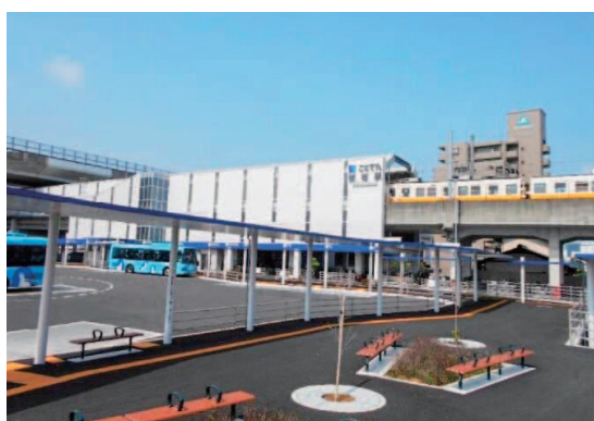
令和2(2020)年11月に開業された伏石駅

高松市西部南地域の核となる駅として、利便性の向上と交通結節拠点機能を強化するため、JR端岡駅の駅舎や駅前広場、国道からのアクセス道路等の一体的な整備に取り組みます。