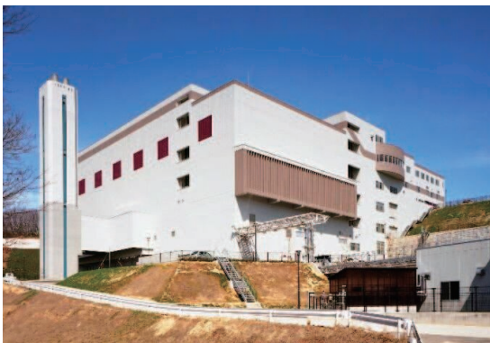
南部クリーンセンター

市民の生活環境の保全や公衆衛生の向上に寄与し、将来にわたり安定したごみ処理体制を確保するため、廃棄物エネルギーの利活用や環境学習機会の提供などの視点を踏まえた、次期ごみ処理施設の整備に取り組みます。