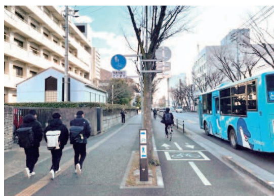
車道の車線数を縮小して整備された自転車道 (歩行者と自転車を分離)