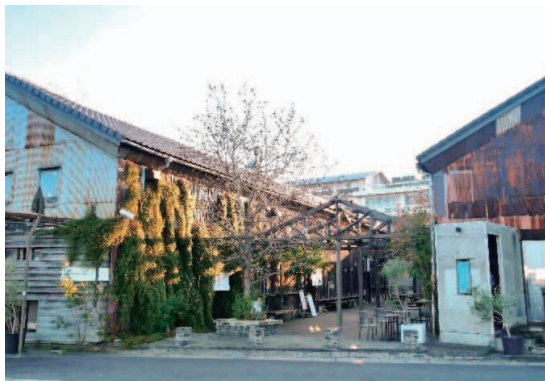
倉庫等をリノベーションした複合商業施設

中央商店街等のにぎわいを取り戻し、商業機能の強化を図るため、新規出店の際の空き店舗の改装支援や商店街共同施設の新設・改修の支援に取り組みます。