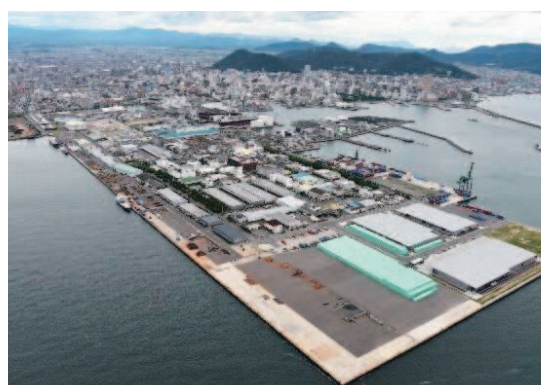
高松港国際物流ターミナル