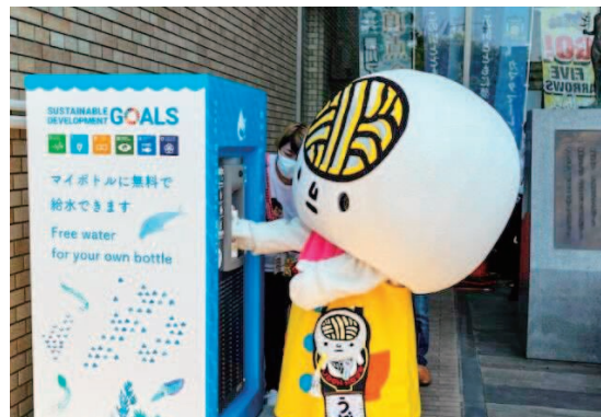
高松市役所前に設置した給水スポット