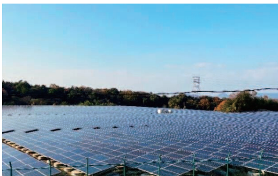
遊休地に設置された太陽光発電システム

脱炭素を通じて地域課題を解決し、地域の魅力と質を向上させる脱炭素地域づくりを推進するため、産学民官の多様な主体との連携により、環境配慮行動の促進や様々な分野での再生可能エネルギーの積極的な活用など、グリーントランスフォーメーション (GX) の推進に取り組みます。