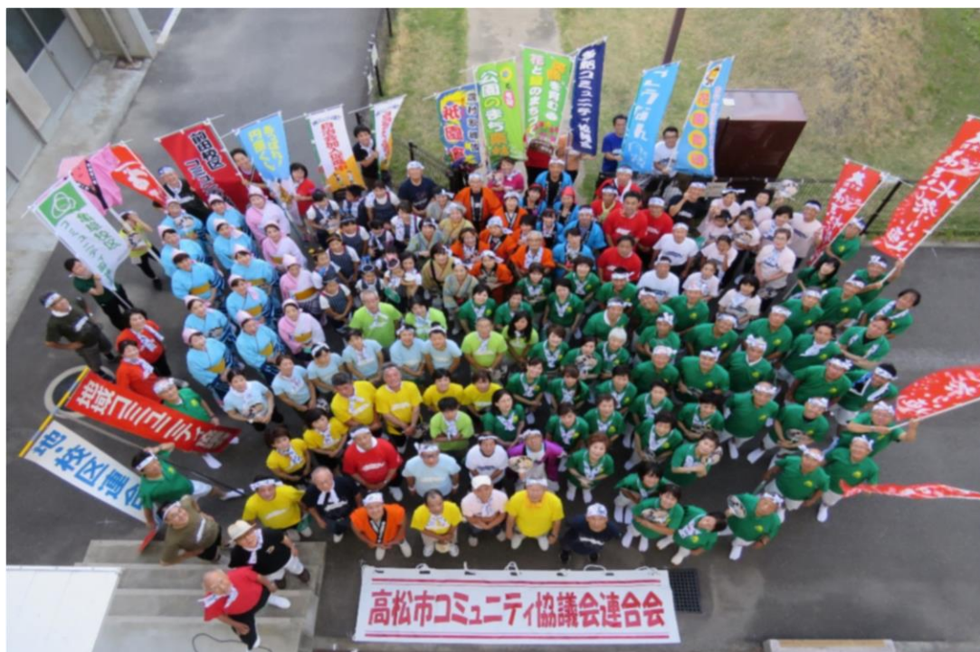
地域コミュニティ協議会の皆さん