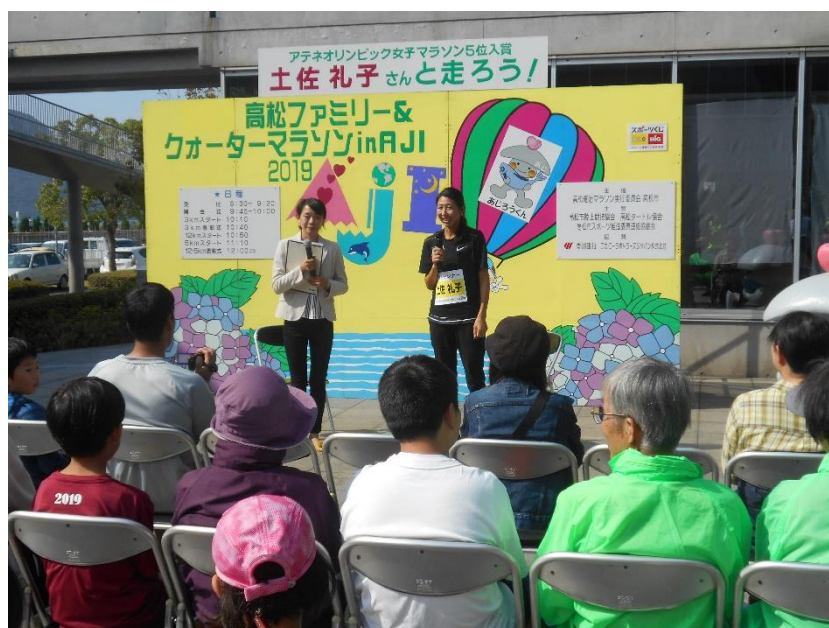
スポーツイベントにおける事業連携(企業所属アスリートの派遣)