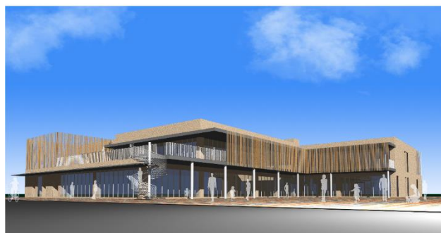
中部総合センター（仮称）完成イメージ