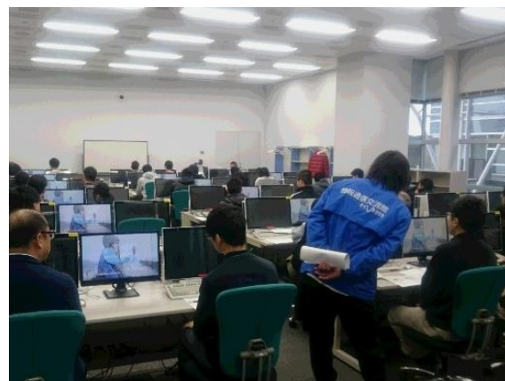
データ利活用人材の育成講座