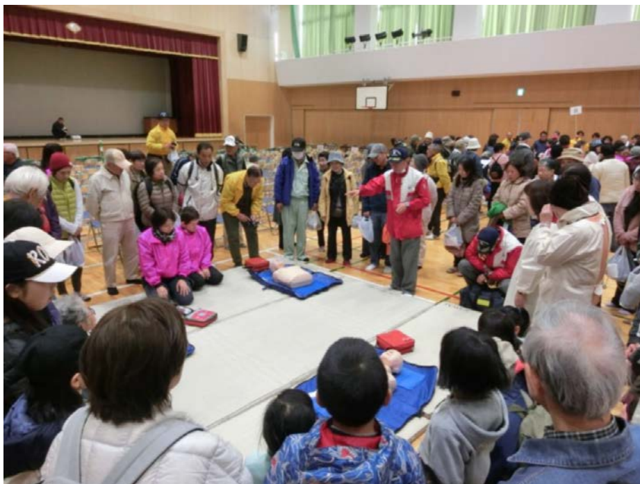
防災訓練の様子（松島地区）