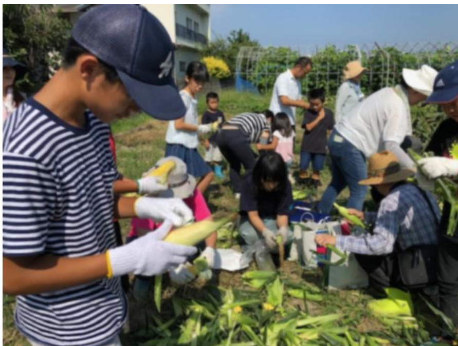
自治会交流活動の様子（庵治地区）