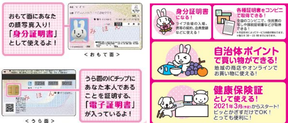
マイナンバーカード利活用の一例