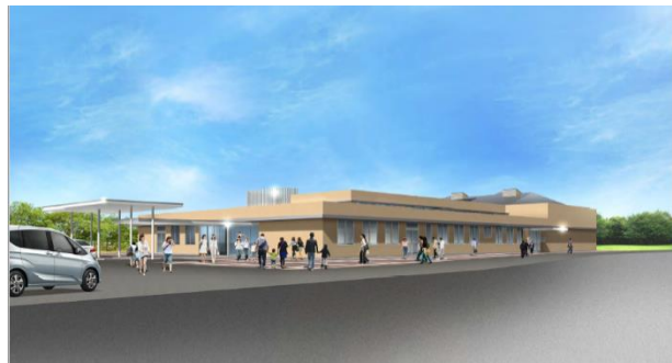
東部南総合センター（仮称）完成イメージ