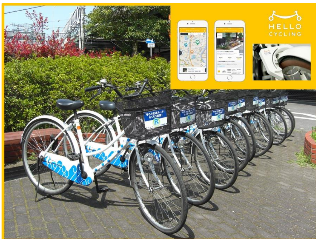
レンタサイクル（レンタサイクルアプリ及びスマートロック）