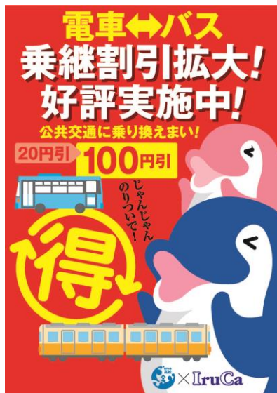
電車・バス乗継割引