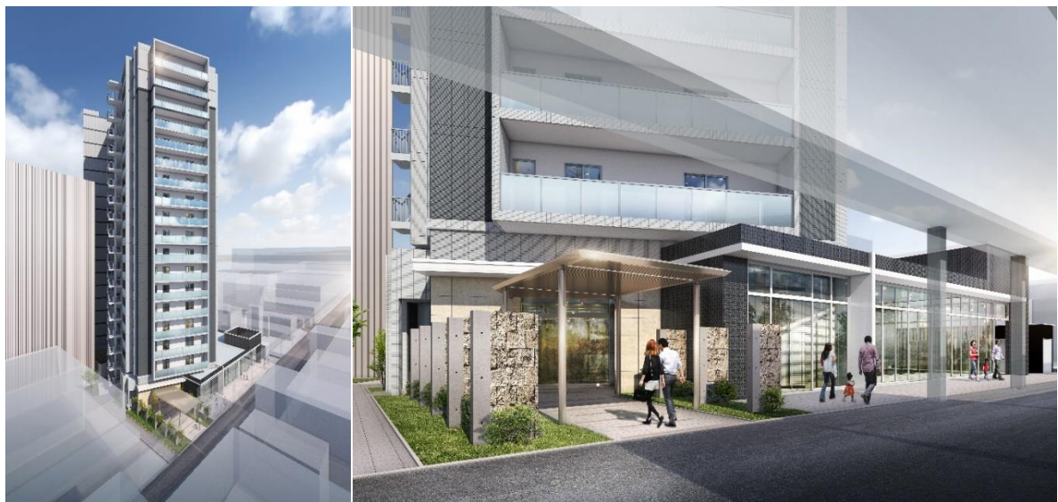
常磐町優良建築物完成後のイメージ