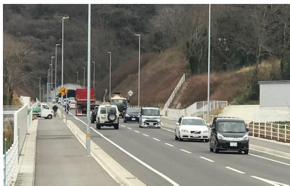
都市計画道路 木太鬼無線（鶴市工区）