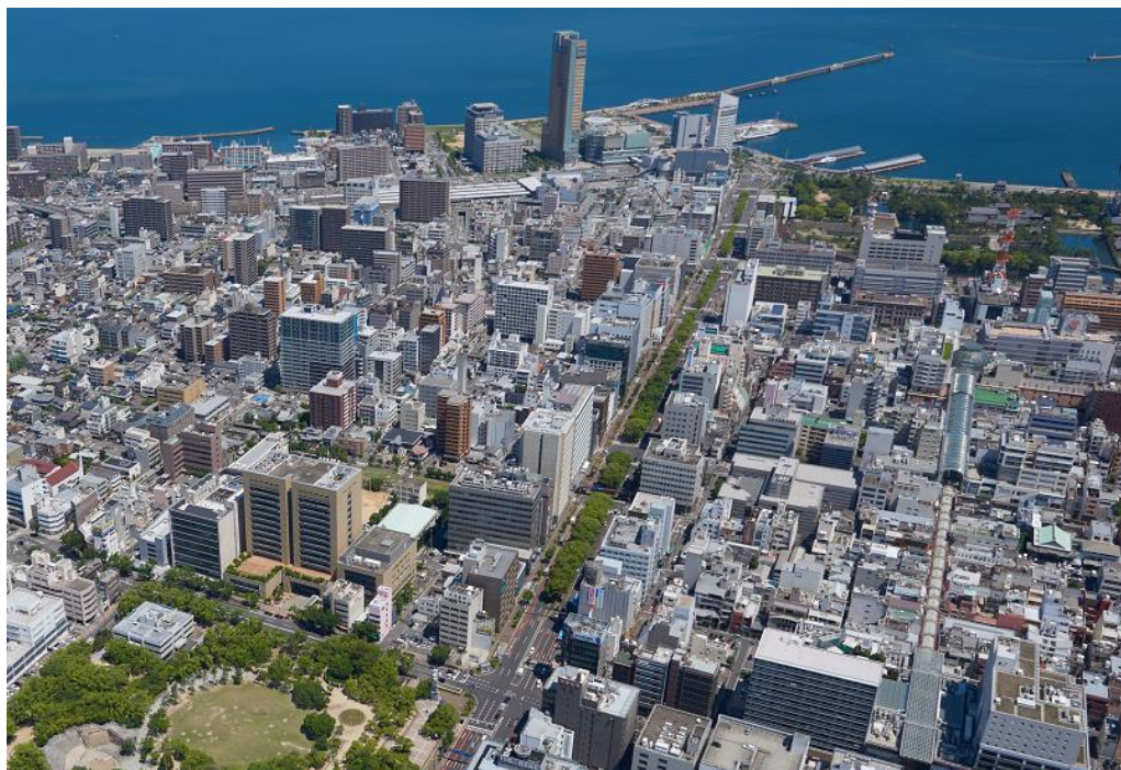
上空から見た中心市街地