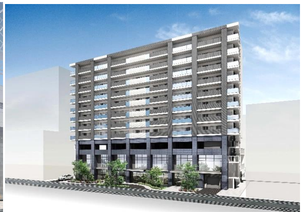
大工町・磨屋町再開発ビル完成後のイメージ