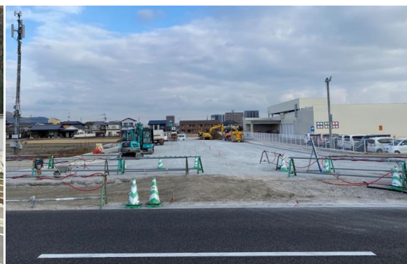
都市計画道路 朝日町仏生山線（整備中）