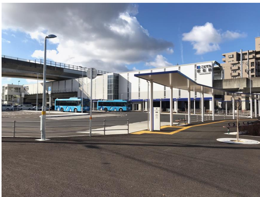
ことடன்伏石駅及び駅前広場