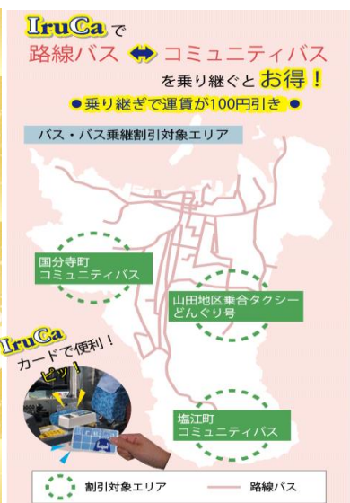
バス・バス乗継割引