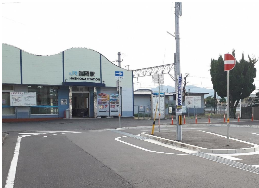
JR 端岡駅及び北口広場