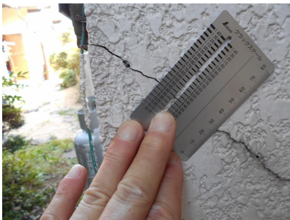
既存住宅の診断（外壁クラック計測）