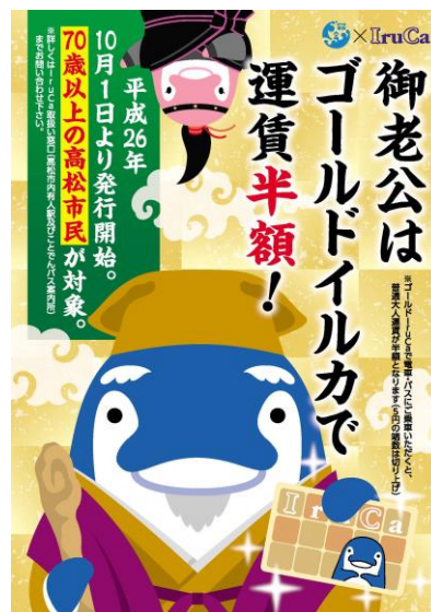
高齢者公共交通利用運賃割引