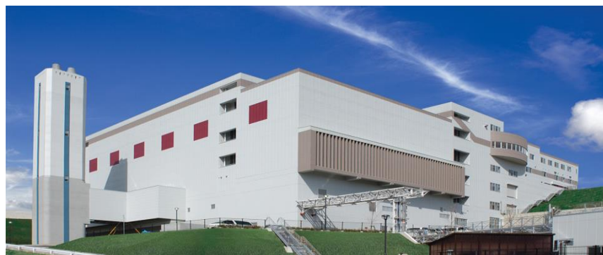
現在の南部クリーンセンター