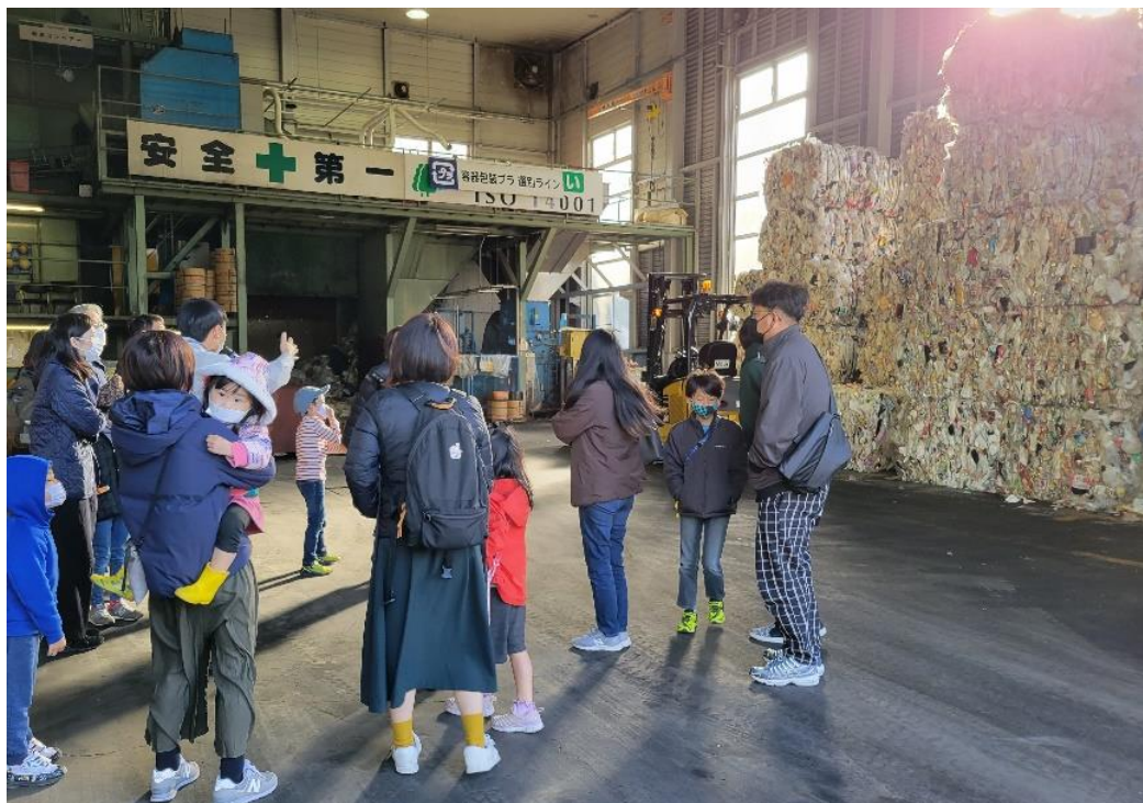
プラスチック容器包装ごみ処理工場見学会