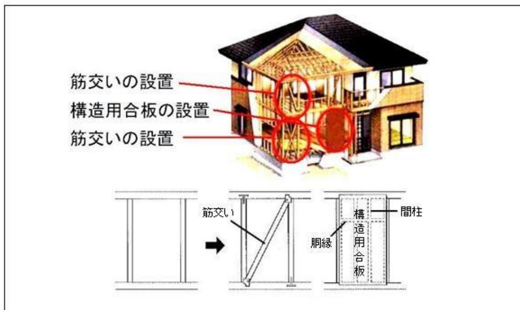
住宅耐震改修のイメージ