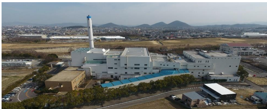
現在の西部クリーンセンター

※施設整備事業は、全工程中、基本設計完了で20%、実施設計完了で30%、その後の工事工程については事業費で進捗率を管理