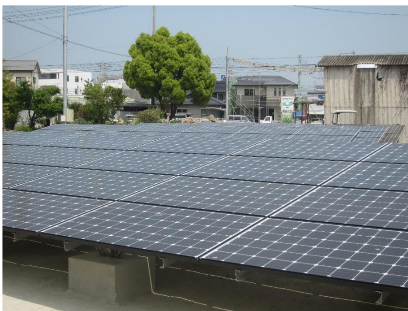
市有地貸出による太陽光発電(菜切浄水場跡地・牟礼町)