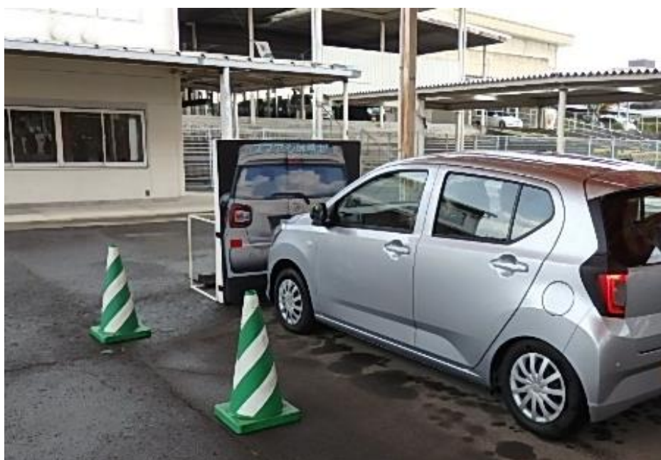
サポカーを使用したシルバードライバーズスクール