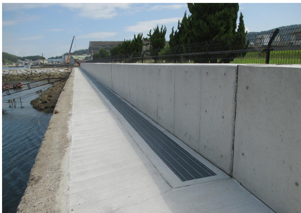
整備後の防潮壁 (庵治港)