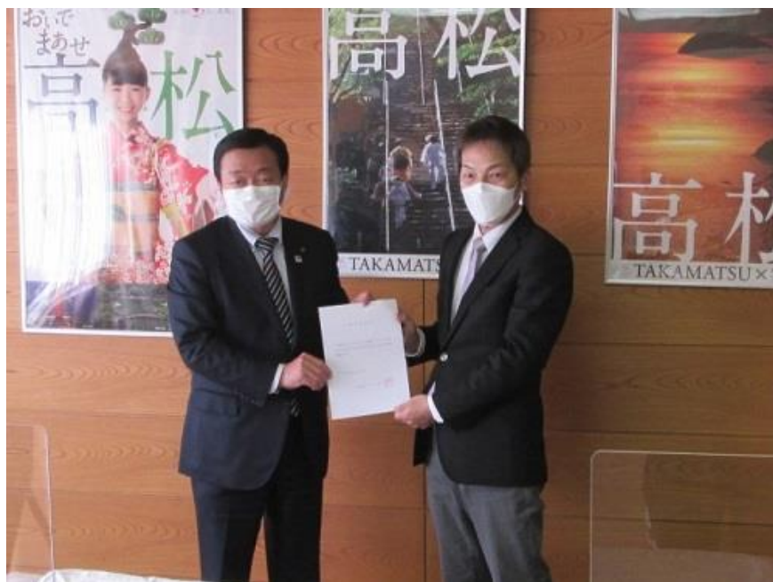
ゼロカーボンシティ推進アドバイザーの委嘱式