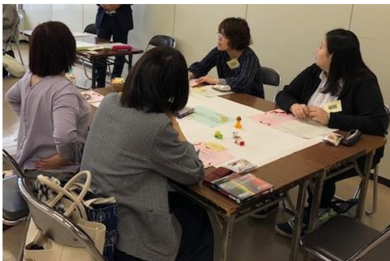
スクールソーシャルワーカー研修会