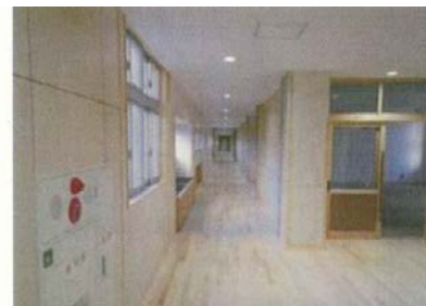
改修後) 廊下の壁を一部撤去し多目的スペースを整備