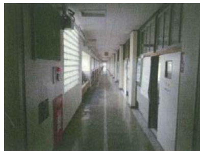
改修前) 壁を一部撤去する前の廊下