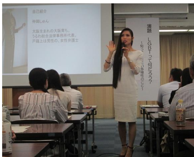
令和元年度 LGBT講演会の様子