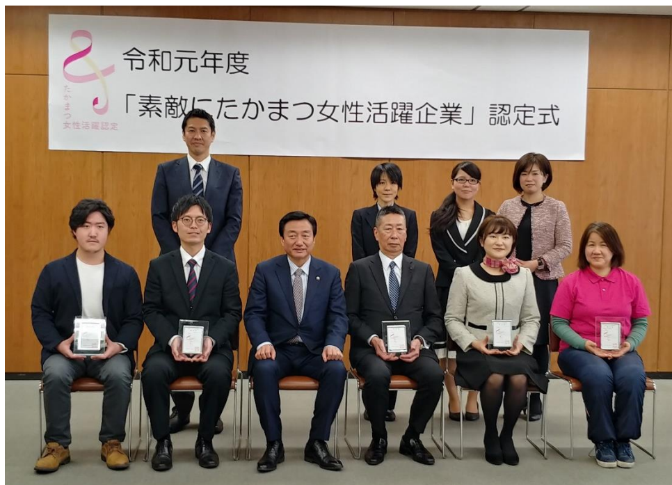
令和元年度 素敵にたかまつ女性活躍企業認定式