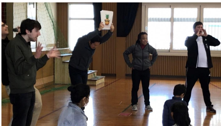
教育フォーラムの英語体験教室