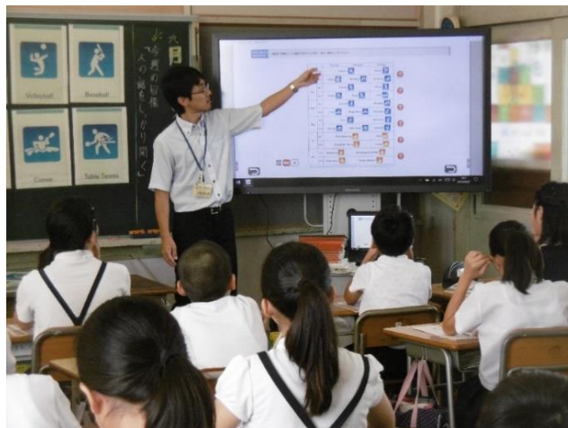
授業での電子黒板の活用