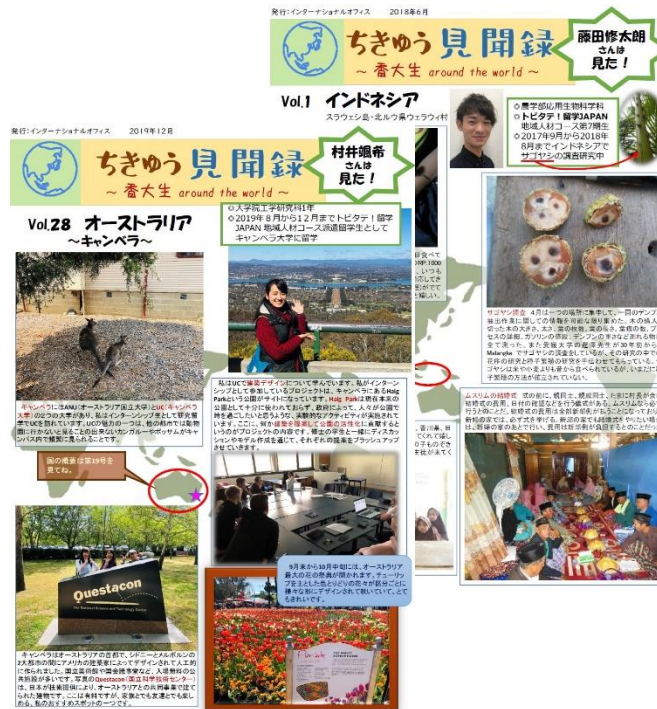
香川地域活性化グローバル人材育成プログラム 派遣留学生活動記録