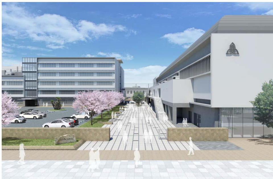
改築後の高松第一高等学校北側外観イメージ

※施設整備事業は、全工程中、基本設計完了で20%、実施設計完了で30%、その後の工事工程については事業費で進捗率を管理