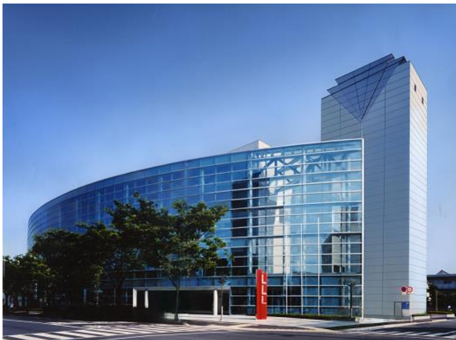
サンクリスタル高松