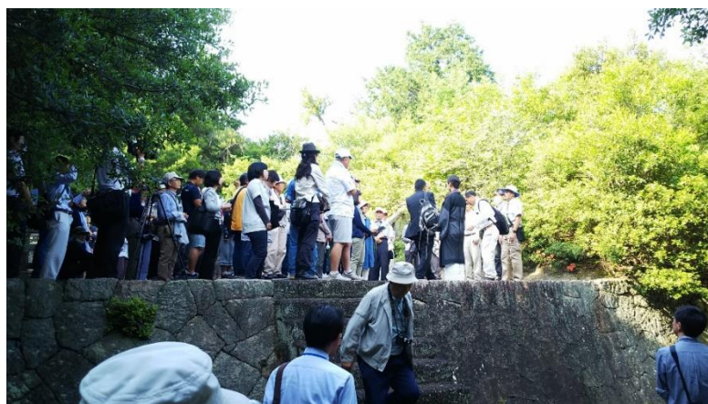
松平家墓所 現地見学会の様子

※連携市町 (○：既に連携している市町、◎：取組を拡充する市町、●：令和4年度から新たに連携する市町)