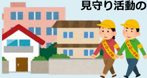
見守り活動の実施