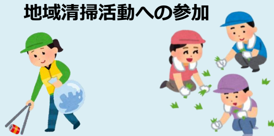
地域清掃活動への参加