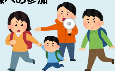
地域防災訓練への参加