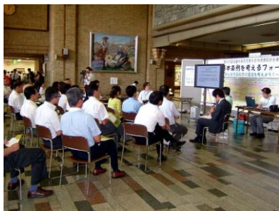
写真：フォーラムの様子

会場では、参加した市民のみならず皆さんに意見を書いてくださいとお願ひしたこともあり、いろいろなご意見を頂けました。概ね好意的な感想や応援メッセージが多く、自治基本条例に盛り込む内容についての意見もありました。