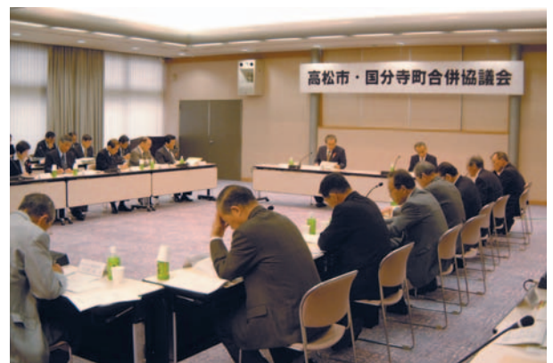
合併協議会の会議風景

これまで利用しにくかった各町の施設やサービスが、今までよりも気軽に利用できるようになります。