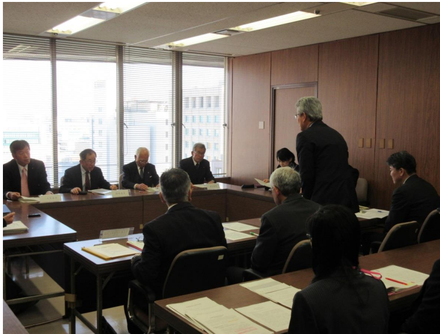
監査委員による高松市中学校体育連盟への事情聴取