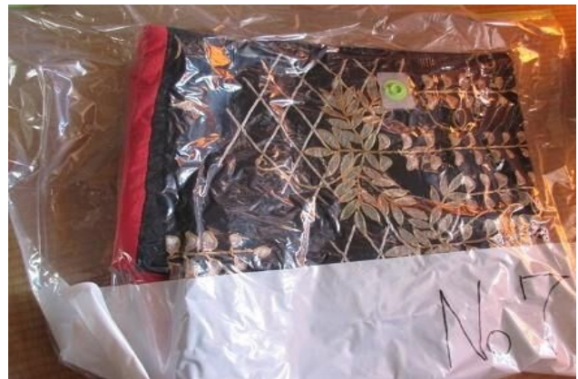
祇園座衣装(保存状態)