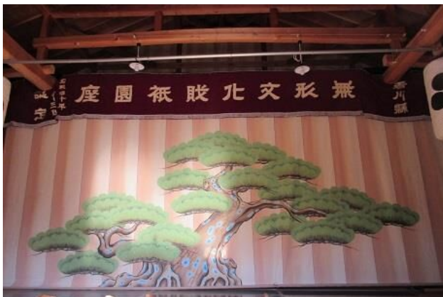
「祇園座」農村歌舞伎小屋

※香川町農村歌舞伎保存会「祇園座」は、同町東谷地区にある農村歌舞伎小屋を始め、各地で公演等を行っている。令和3年度は、農村歌舞伎小屋において10月24日に開催した。