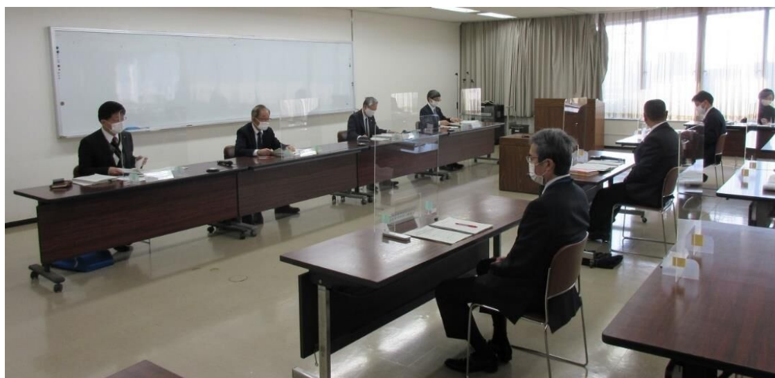
事情聴取（令和4年1月28日実施）の状況

今後とも市民の信頼を得られるように、法令等を遵守し、より一層、厳正かつ適切な事務の執行に努められたい。