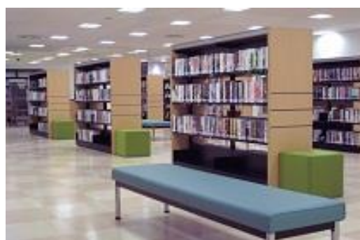
中央図書館瓦町サテライト（瓦町FLAG8階 市民交流プラザ | KODE 瓦町 内）