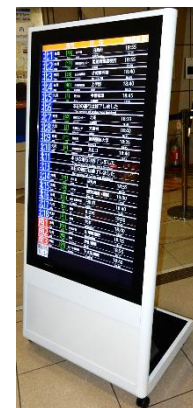
市役所本庁舎設置 サイネージイメージ図

高松市役所等に、ことでんバスが運用しているバスロケーションシステムと連動したデジタルサイネージを整備する。バスの運行状況についてスマートフォン以外の媒体でも、リアルタイムで可視化することにより、観光流動における利便性向上を図るとともに、利用者が路線・ダイヤを選択し、三密を避けやすくする。