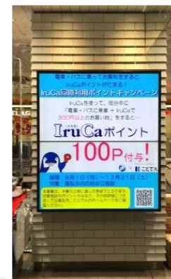
電車内中吊り広告 瓦町駅コンコース広告