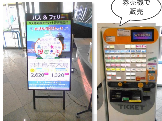
高松空港内サインージ広告