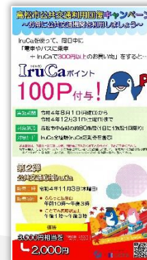
商業施設内サイネージ広告