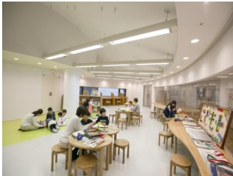
こどもアートスペース

リニューアルとともに開設した「こどもアートスペース」への参加人数は、年々増加する傾向にある。今後は、未就学児はじめ様々な世代等に親しまれる教育普及プログラムを積極的に展開。