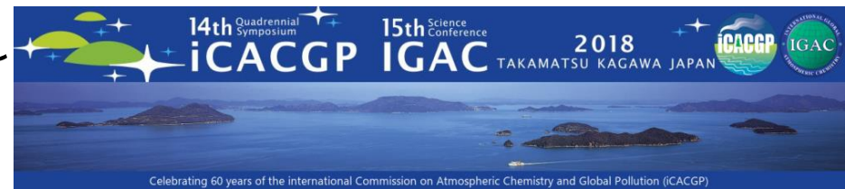
第14回iCACGP・第15回IGAC合同国際会議

高松空港の国際線利用者数等が 上昇傾向にある中、受け入れ 態勢の強化及び、旅行客の 誘致のための、観光プロ モーションを行った。