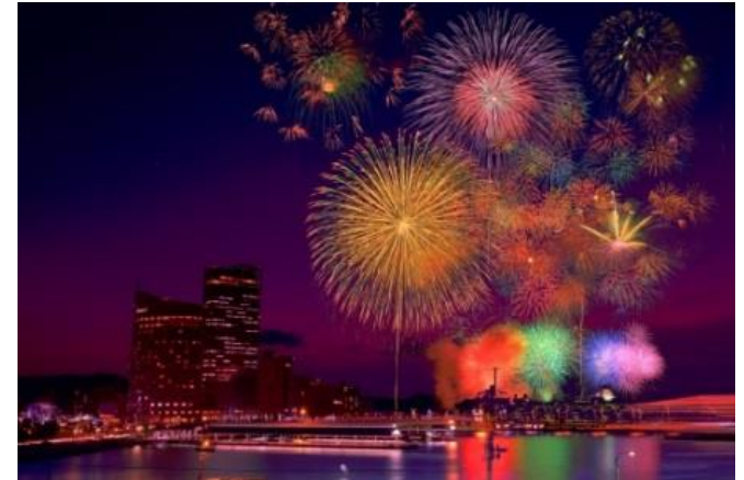
さぬき高松まつり