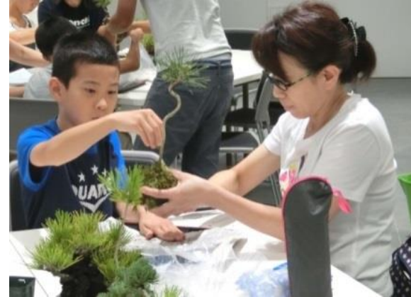
伝統的なものづくり親子体験教室