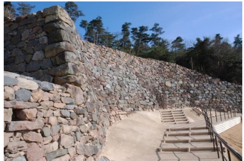
屋嶋城跡城門遺構

屋嶋城跡城門遺構を整備するとともに、建造物である城門をCGで見られるアプリの導入及びタブレットの貸出しを実施し、文化財の積極的な活用を図った。高松城跡等整備事業については、石垣の修理工事を行うとともに、桜御門の復元を進めている。