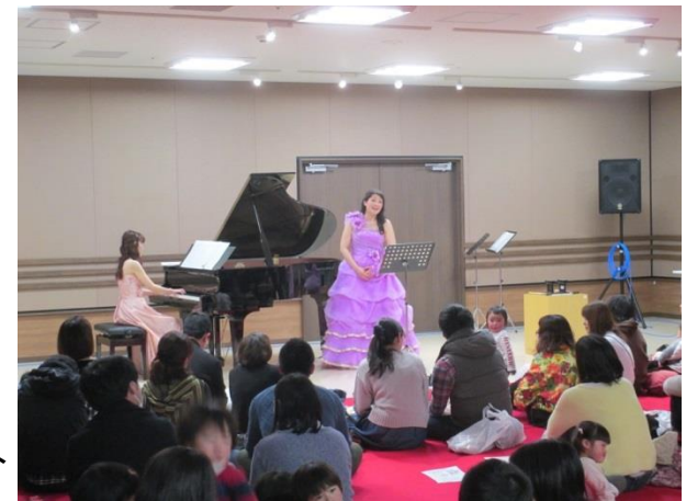
0才からのコンサート