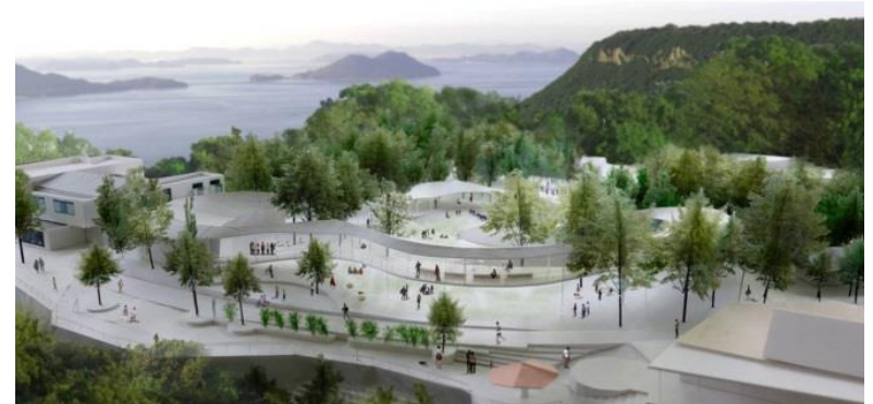
屋島山上拠点施設イメージ