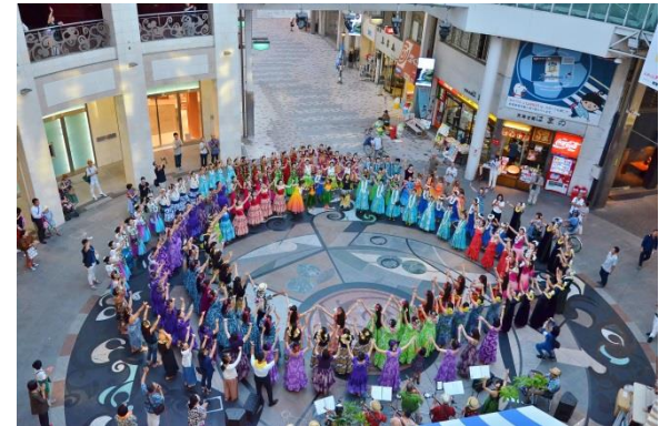
まちなかパフォーマンス事業