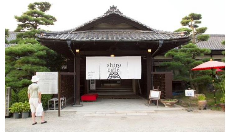
匠のおもてなし事業