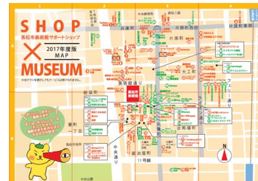
高松市美術館サポートショップ事業

サポートショップ参加店舗数は年々増加し、事業の定着が見られる。今後も継続して実施する。