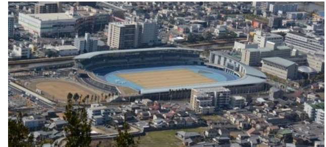
屋島レクザムフィールド

屋島競技場及びヨット競技場はしゅん工し、施設の積極的な活用を図っている。高松市立りんくうスポーツ公園については、7月にしゅん工、8月にオープニングイベントを実施予定。