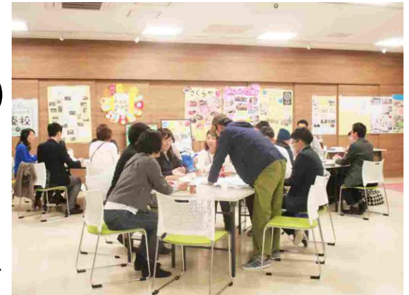
市民活動センター運営事業

活動実績（市民活動センター総利用者数）は、年々増加する傾向にある。引き続き、多様な主体が地域社会を支える新しい仕組みづくりや人材育成のため、事業を継続する。