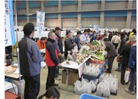
たかまつ食と農のフェスタ