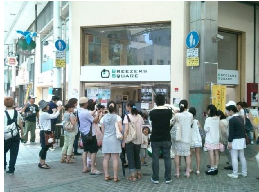
ブリザーズスクエア運営事業

平成30年度以降は、南部商店街エリアの活性化を「高松南部3町商店街プロジェクト」が引き続き実施。