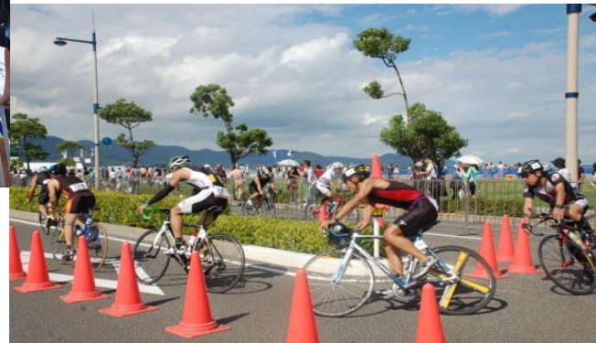
サンポート高松トライアスロン