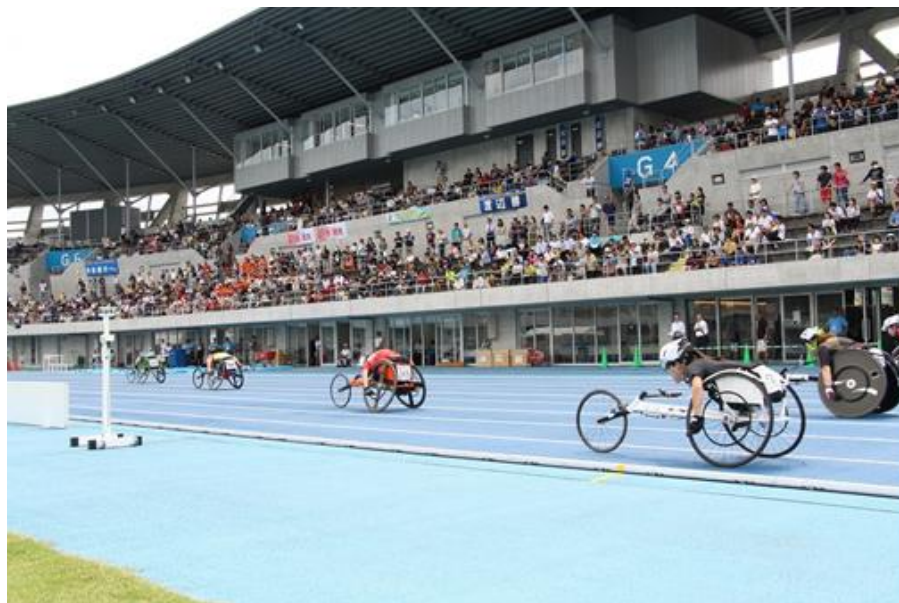
第29回日本パラ陸上競技選手権大会の様子

新型コロナウイルス感染症対策を講じ、大会運営を行うほか、子ども達への心のバリアフリー醸成につながるイベントを企画し、障がい者スポーツの推進に努める。