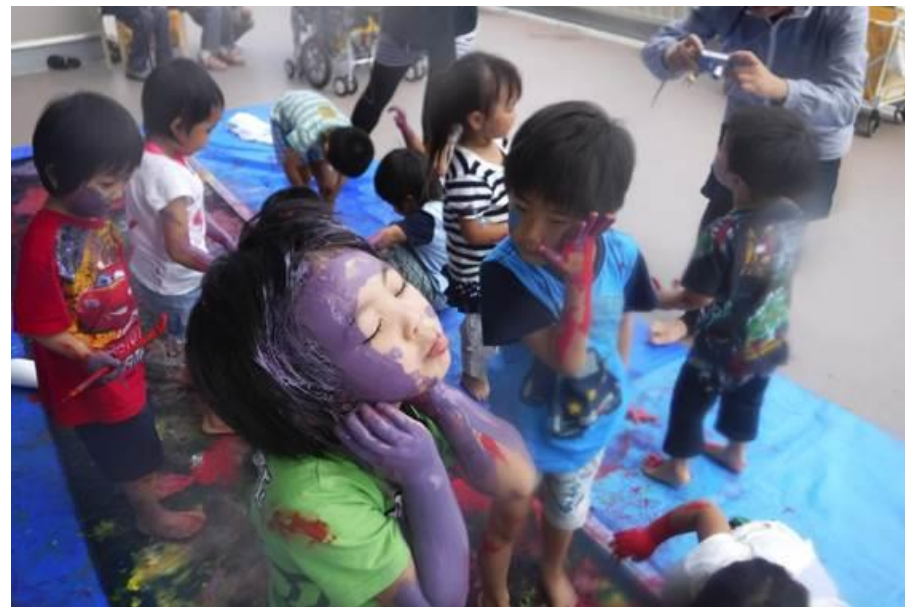
芸術士派遣事業の様子