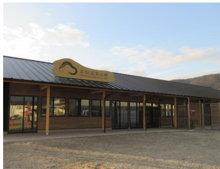
「高松盆栽の郷」拠点施設