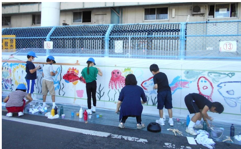
地元小学生とアーティストで協力して水産物棟に制作した120mのウォールアート

withコロナの時代におけるイベントの在り方を検討しながら、既存イベントの見直しや新規イベントの企画を行い、新型コロナウイルス感染症対策を講じた上で、内容の充実を図りながら実施する。