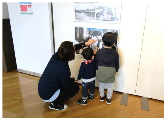
戦争遺品等収蔵品巡回展の様子

令和3年3月18日(木)から3月30日(火)まで、高松市香南歴史民俗郷土館で「戦争遺品等収蔵品巡回展」を開催しました。高松空襲関係資料や戦時下のくらしの写真等、パネル、絵画22点、戦争遺品等27点を展示しました。特に戦争遺品は、由佐村(現・香南町)での疎開生活の様子を描いた絵画や池西村(現・香南町)役場に残っていた未使用の国民兵召集令状など、香南町や近隣の地域にゆかりのあるものを中心に展示しました。ご来場の皆様、ありがとうございました。