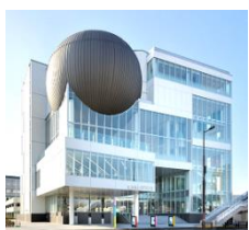
たかまつミライエ

しかし、戦況が悪化し、物資の不足がその度を増すとともに、切符や購入券があっても店には品物が無い状態になった。