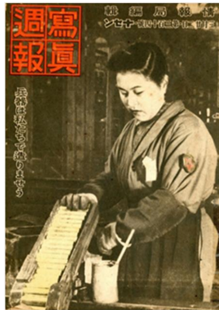
1944年3月22日発行の第314号

表紙に関連した女性の労働についての見開き記事には、「工場があなたの花嫁学校だ。」「あなたの身も心も決戦乙女に生まれ変わっていく。」の言葉が盛り込まれており、当時の国策や国民の暮らしを知ることができる貴重な資料である。