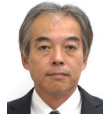
教育局長 伊佐 良士郎