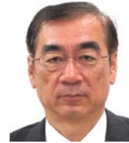
健康福祉局長 藤井 敏孝