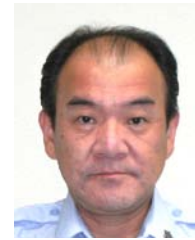
消防局長 高島 眞治