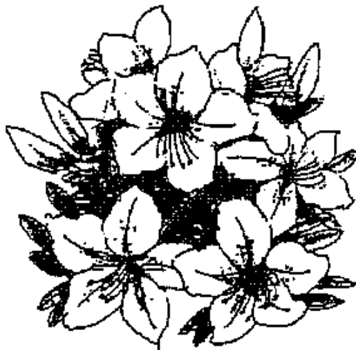
市花 つつじ (さつきを含む)