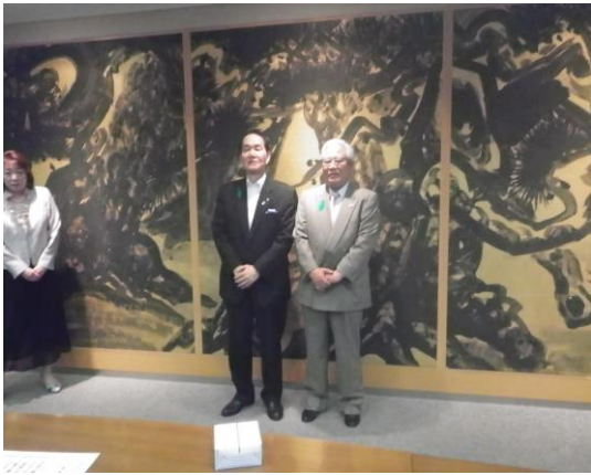
（直寫会長 写真右側）