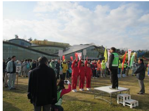
平成30年1月21日高松エアポートクリーン作戦