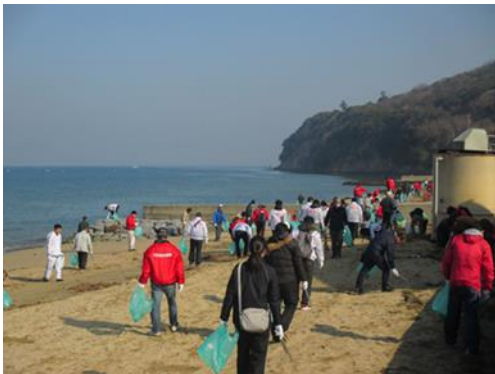
平成30年3月4日屋島クリーン大作戦