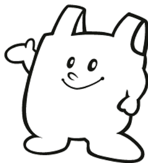
レジ袋等の削減推進シンボルキャラクター (愛称 エコバックくん)

平成20年に市民等から公募し、応募総点数160点から、優秀賞の作品を「レジ袋等の削減推進シンボルキャラクター(愛称 エコバックくん)」として選定した。