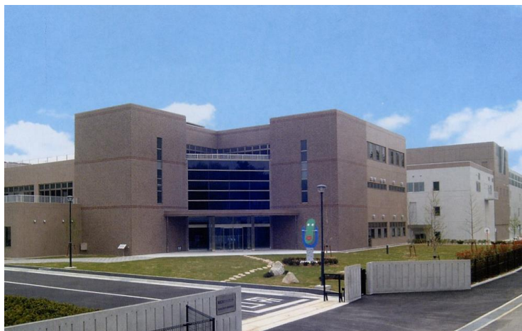
《写真 南部クリーンセンター》

高松市塩江町安原下第3号 2084 番地 1 TEL 087(890)2190 FAX 087(890)2191