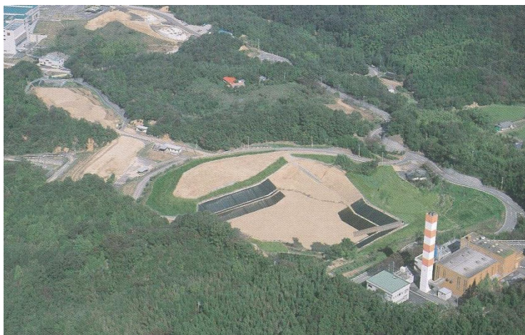
《写真 南部クリーンセンター埋立処分地》