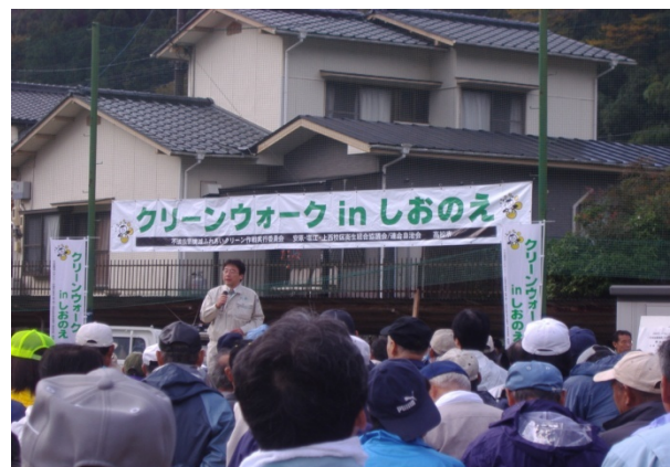
クリーンウォーク in しおのえ (平成 20 年 11 月 16 日)