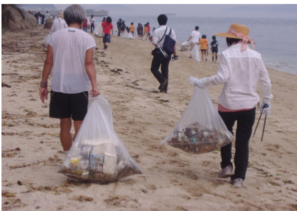
あじ水ぎわクリーン作戦 (平成 20 年 7 月 8 日)