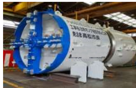
シールドマシン(工場検査時)