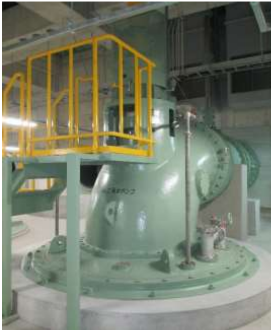
福岡ポンプ場 立軸ポンプ

下水道事業計画区域内における浸水被害を軽減・解消するため、中心市街地浸水対策計画等に基づき、引き続き、雨水幹線及び雨水ポンプ場の整備を進めています。