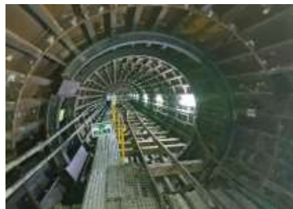
西部バイパス幹線 管きよ内(一次覆工状況)