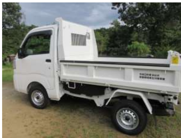
推肥運搬用軽四ダンプトラック

家畜排泄物の適正処理の指導及び処理・保管施設の設置・整備を推進しています。令和3年度には、推肥運搬用軽四ダンプトラックを導入し、円滑に糞尿処理を行って、近隣住民の苦情を防ぎ、さらに周辺耕地へ約22tの堆肥を供給しました。