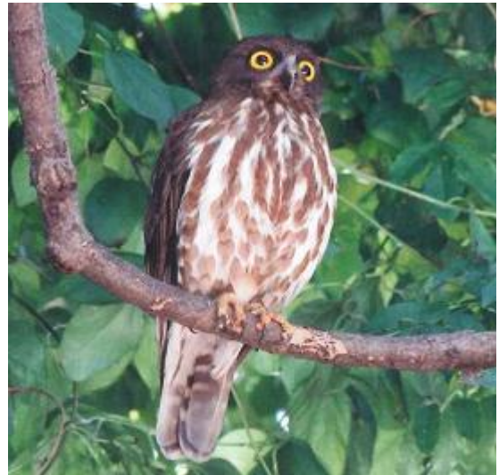
夏、渡来するアオバズク（一宮町）

大滝山から竜王山にかけての讃岐山脈（塩江町）の上部は、野鳥の宝庫です。夏期には、ミソサザイ、ヤマドリ（準絶滅危惧）、トラツグミ、ヒガ