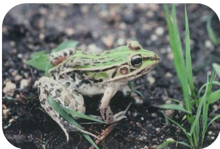
かつては水辺に多く生息していた トノサマガエル（西植田町）

高松の自然は、合併により広域になり、更に多様化しました。香東川は徳島県境の源流が瀬戸内海に注ぐ河口までの全てが高松市となり、河川全体の生態系を考えるよい機会になりました。私たちには祖先から受け継いだ自然の生態系を保全し、子孫に伝えなければならない責務があります。