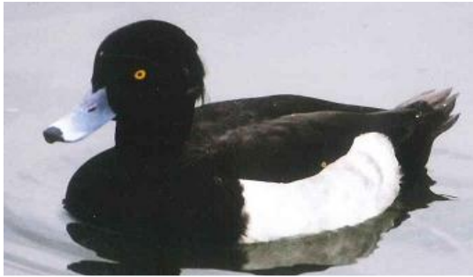
冬、ため池に渡来するキンクロハジロ（香川町）

高松の市街地の緑地には、鳥類の休息地、繁殖地、餌場にもなっています。特に、夏の終わりと初冬にかけての中央通りは、スズメやムクドリが集団ねぐらが目立ちます。そのうちのムクドリは、昭和50年ごろより高松市内に現れ始め、急速に増加し、夜間には街路樹やビル屋上の広告塔を集団ねぐらとして利用するようになりました。また、学校や公園、民家などの樹木ではキジバトやヒヨドリなどが営巣したり、冬期には街路樹の実を求めてレンジャク類やツグミなどの冬鳥が多数渡来しています。