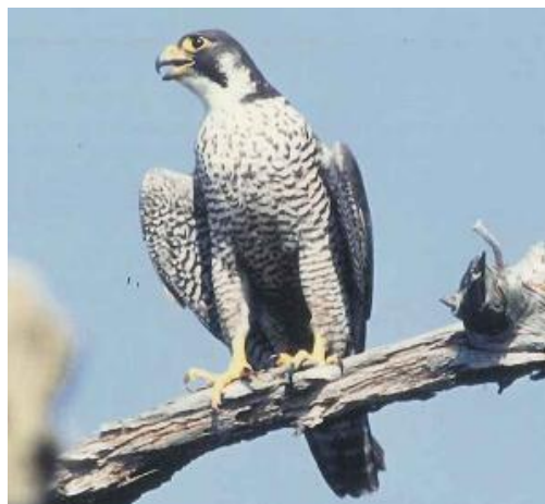
海岸の崖地に生息するハヤブサ（庵治町）

屋島や五剣山の岩場には、ハヤブサ（絶滅危惧Ⅱ類）が生息しています。ハヤブサは、海岸の崖地で繁殖するからでしょう。また、屋島では、ミサゴ（準絶滅危惧）が、かなり高い密度で生息し繁殖しています。その理由は、近くの新川、春日川の河口付近にミサゴの餌となるボラなどの魚類が豊富に生息していることも一因と考えられています。