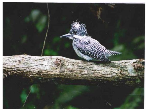
溪流沿いに生息するヤマセミ

ラ、アオゲラ、イカル、カケスなどの留鳥が繁殖しています。それらに加えてサシバ、ホトトギス、カッコウ、ツツドリ（準絶滅危惧）、ヤイロチョウ（絶滅危惧Ⅰ類）、ヨタカ（絶滅危惧Ⅱ類）などの夏鳥が渡来しています。また、その谷間を流れる溪流では、カワガラス、ヤマセミ（絶滅危惧Ⅱ類）ときには、アカショウビン（絶滅危惧Ⅱ類）などが美しい姿を見せて営巣しています。このように讃岐山脈に生息する鳥類は、平地で見ることのできない貴重な自然を見せてくれます。そこは正に、高松市における自然の奥座敷でもあります。そして、そこは河川によって高松平野や瀬戸内海の生き物たちとも、生態的に繋がっているのです。