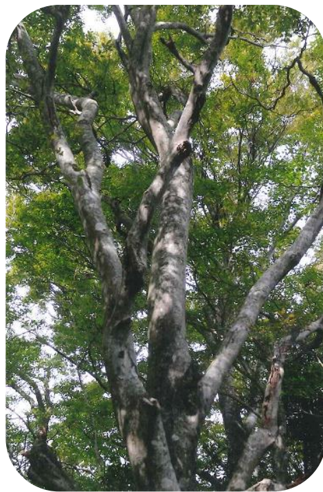
大滝山のブナ（塩江町）