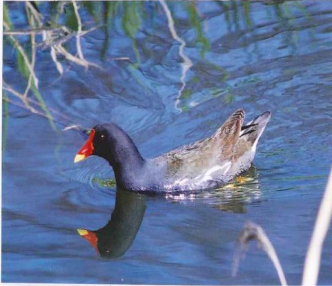
川沿いの草むらや水田で繁殖するバン

セミなどが常に見られます。特に、ヨシやツルヨシの群落では、夏期にオオヨシキリ、バン、ヒクイナ（絶滅危惧Ⅱ類）、タマシギ（絶滅危惧Ⅱ類）などが繁殖し、冬期にはオオジュリン、ツリスガラなどが越冬しています。このように貴重なヨシやツルヨシの群落が急速に姿を消している現状を見ると大変心配になります。