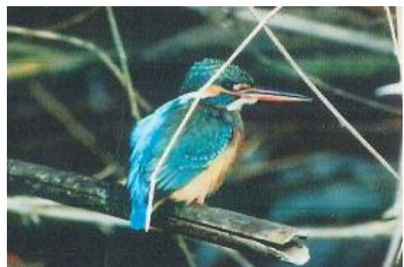
春日川に生息するカワセミ（川島東町）

カモ類が比較的多く渡来するため池は、上記のほか高月池（飯田町）、御殿貯水池（鶴市町）、衣懸池（鬼無町）、奈良須池（岡本町）、久米池（新田町）、羽間下池（牟礼町）、公淵池（東植田町）、龍満池（香川町）、内場池（塩江町）などがあります。なかでも内場池には、毎年100羽ほどのオシドリが越冬していることは特筆に値します。