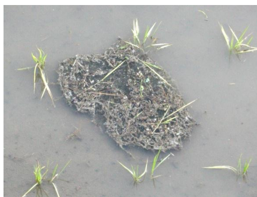
トノサマガエルの卵囊 (塩江)

ウオが多数生息していました。現在は、開発等により生息場所である湧水や小さな谷間の水たまりが消失し、絶滅寸前になっているところが多くあります。山際の小さなため池では、外来種（特定外来生物）のウシガエルが日本固有種のニホンヒキガエルの産卵場所に侵入し、種間競争が激化しています。屋島周辺では、2013年の調査で4年ぶりにニホンヒキガエルの産卵を確認することができました。五色台には、ニホンヒキガエル・アカハライモリ・タワヤモリがわずかに生息しています。塩江町は、旧来の自然が最も多く残され、市内で確認できる種のうち、ミシシippアカミミガメ以外のすべての種が確認されています。