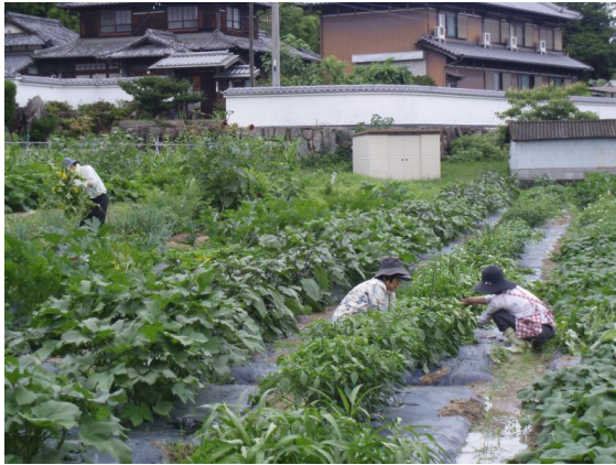
西植田いきいき市民農園