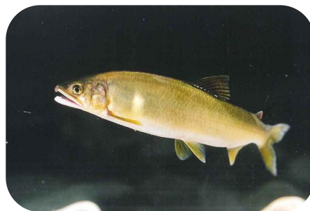
かつて香東川や御坊川に生息していたアユ（塩江町）