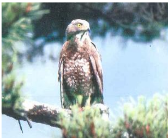
夏、山地に渡来するサシバ（塩江町）

一方、最近になり、香西北町の芝山や庵治町の鎧島などでは、魚類を餌とするカワウが多数生息するようになり住環境の悪化や漁業被害が心配