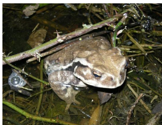
ニホンヒキガエル（男木島）

※ 特定外来生物とは、もともと日本にいなかった外来生物のうち、生態系などに被害を及ぼすものが指定されており、飼育・栽培・保管・運搬・販売・譲渡・輸入などが原則として禁止されています。