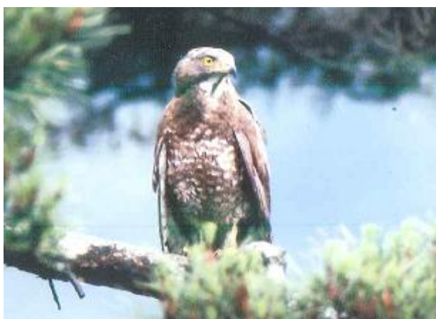
夏、山地に渡来するサシバ（塩江町）

高松市の北部の瀬戸内海には、男木島、女島、大島、大槌島、小槌島などの島々が浮かび、五色台、屋島、庵治町の遠見山・竜王山などの山地が海岸に接しています。そして、内陸部には、台地形、円錐状の山々やため池が点在する高松平野が広がり、その間を本津川、香東川、御坊川、春日川、新川など