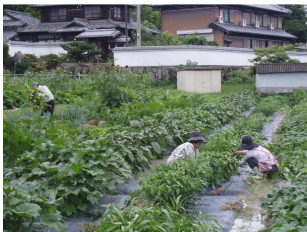
西植田いきいき市民農園