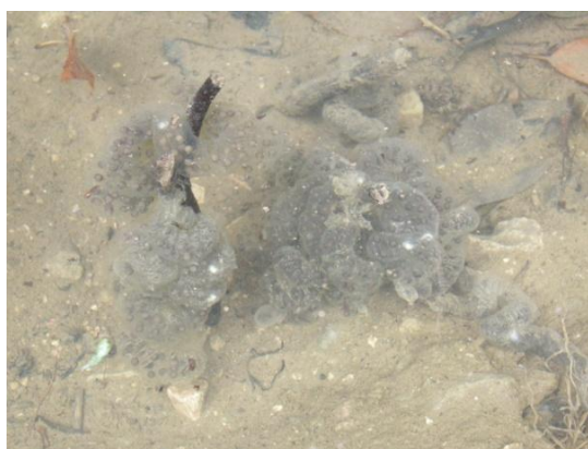
カスミサンショウウオの卵囊（五色台）

山間部の五色台、石清尾山、五剣山、植田地区、塩江町周辺には、かつてはカスミサンショウウオが多数生息していました。現在は、開発等により生息場所である湧水や小さな谷間の水たまりが消失し、絶滅寸前になっているところが多くあります。山際の小さなため池では、外来種（特定外来生物）のウシガエルが日本固有種のニホンヒキガエルの産卵場所に侵入し、種間競争が激化しています。屋島周辺では、2010 年～2012 年の 3 月の調査でニホンヒキガエルの産卵を確認することができませんでした。何らかの環境変化が起こっていると推測されます。五色台には、ニホンヒキガエル・アカハライモリ・タワヤモリがわずかに生息しています。塩江町は、旧来の自然が最も多く残され、市内で確認できる種のうち、ミシシippアカミミガメ以外のすべての種が確認されています。