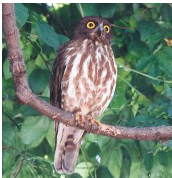
夏、渡来するアオバズク（一宮町）

また、高松平野を流れる新川、春日川、香東川、本津川などの河川も鳥類の重要な生息地です。ここでは、サギ科、セキレイ科、カワセミ科などが常に見られます。特に、ヨシやツルヨシの群落では、夏期にオオヨシキリ、バン、ヒクイナ（絶滅危惧Ⅱ類）、タマシギ（絶滅危惧Ⅱ類）などが繁殖し、冬期にはオオジュリン、ツリスガラなどが越冬しています。このように貴重なヨシやツルヨシの群落が急速に姿を消しています。