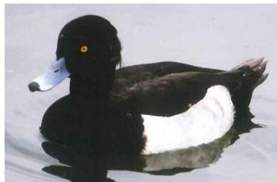
冬、ため池に渡来するキンクロハジロ （香川町）