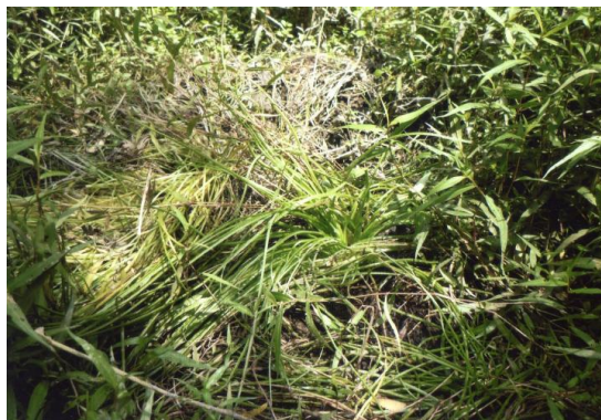
オオバシナミズニラ

マモ群集やコアマモ群集があり、貴重な藻場となっています。湿原植生はありませんが、放棄湿田や溜め池には、ヨシ、ガマ、ヒシ、ガガブタなどの水生植物群落が見られます。水生植物として貴重なオニバスは栗林公園や道池で確認されており、アサザは香川県で唯一久米池に自生しています。また最近屋島の溜め池で発見されたオオバシナミズニラも香川県唯一です。