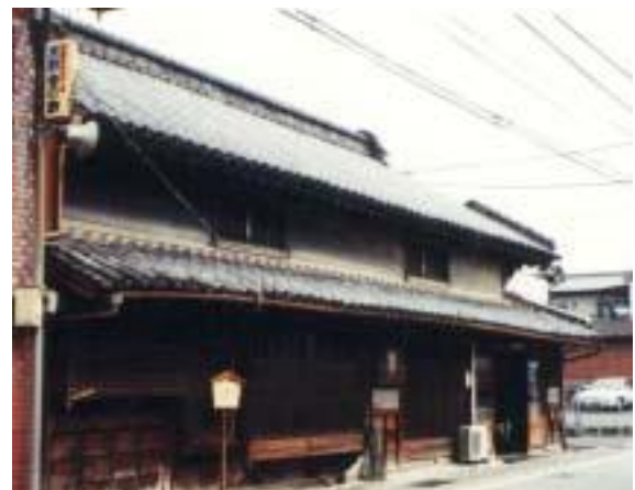
仏生山歴史街道都市景観形成地区

都市景観形成地区以外の市内全域で一定規模以上の建築物等の新築や改築や模様替えの際には，「大規模