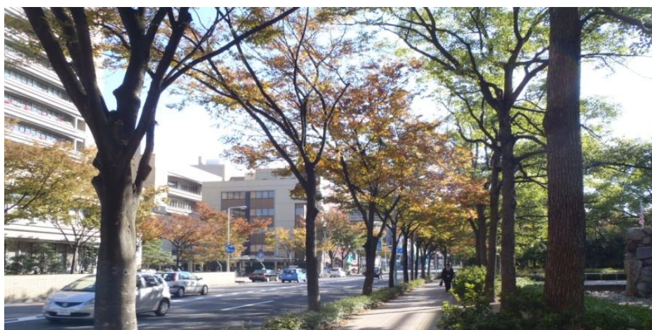
市道五番町西宝線の街路樹（ケヤキ・アベリア）