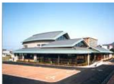
ふれあい福祉センター勝賀