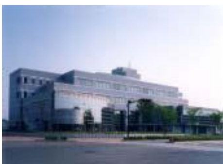
香川県産業頭脳化センター

第2回（平成8年度） 33件の応募の中から10件を決定し、所有者・設計者・施工者を表彰しました。