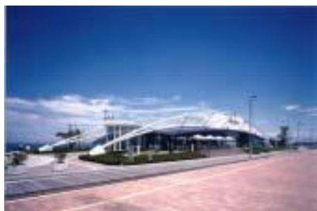
高松港レストハウス

第4回（平成15年度） 50件の応募の中から6件を決定し、所有者・設計者・施工者に対して表彰しました。