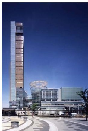
高松シンボルタワー

第5回（平成19年度） 27件の応募の中から5件を決定し、所有者・設計者・施工者に対して表彰しました。