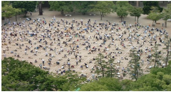
植付風景 (H21. 6. 21)