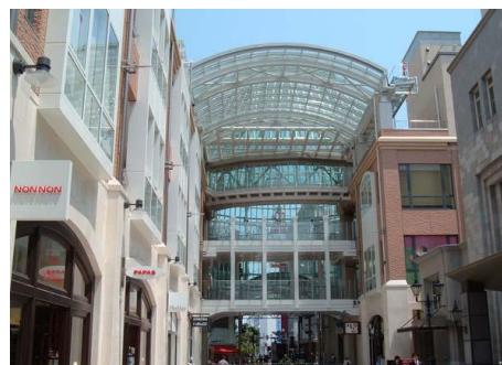
高松丸亀町巷番街ビル