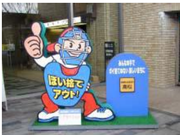
環境美化シンボルキャラクター「アウトくん」

するとともに、愛称は、一般公募により「アウトくん」と命名し、市民にポイ捨て禁止を呼び掛けている。