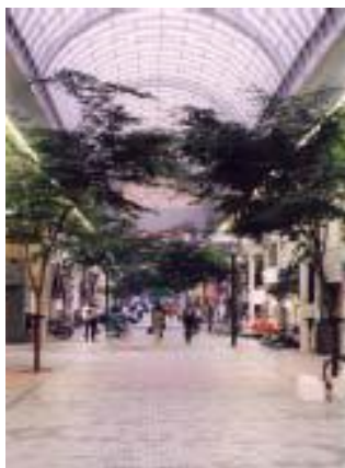
第1回優秀賞 街路樹のあるアーケード街

第2回（平成11年度） 31点の応募作品の中から優秀賞1点・入選5点を表彰しました。