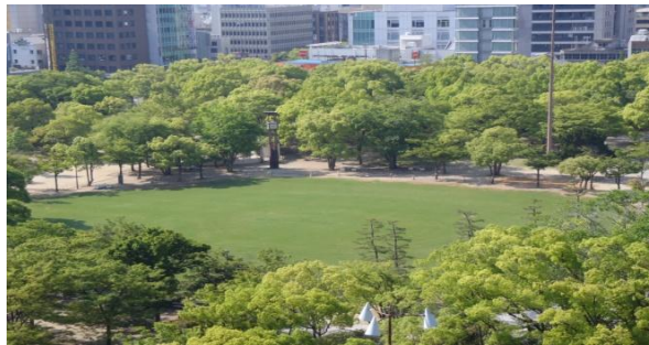
現在の状況 (H23. 5)