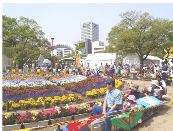
春のフラワーフェスティバル