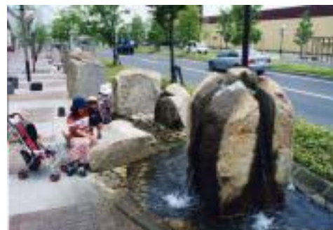
第2回優秀賞 小川のある町