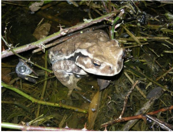
ニホンヒキガエル (男木島)

島嶼部の男木・女木島には、かつて多くのニホンヒキガエルが生息していました。一時期、男木島では産卵池が開発により消失したため絶滅寸前でした。平成12年～15年にかけて個体数が一時的に回復しましたが、現在は一部の