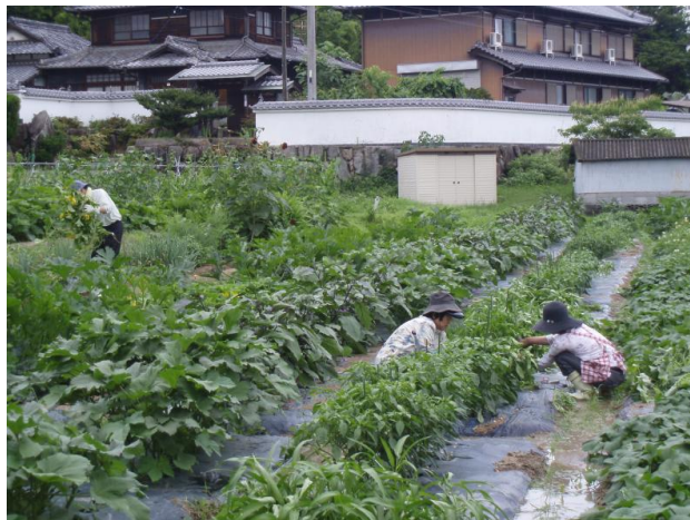
西植田いきいき市民農園