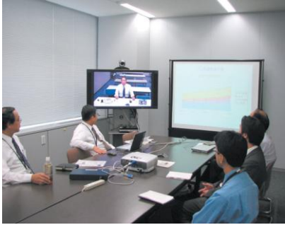
ビデオ会議システム (時間・交通費削減・紙文書資料削減)