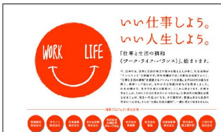
ワーク・ライフ・バランス ノー残業デーの徹底をおこないオフィスでできる省エネ活動