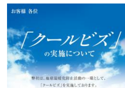
クールビズの実施 地球温暖化防止活動