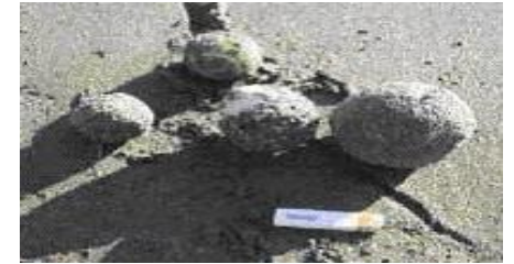
▲ 海に漂着した油のかたまり

台所から油を流してしまうなど、わたしたちが下水道を正しく使っていないと、固まった油が下水道管を詰まらせて、下水道が使えなくなったり、下水処理が正しくできず、街や瀬戸内海が汚れたりするおそれがあります。