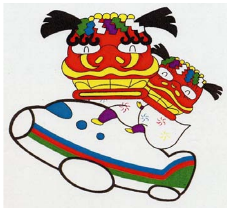
香南地区マスコットキャラクター「ししまるくん」