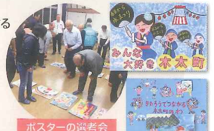
ポスターの選考会