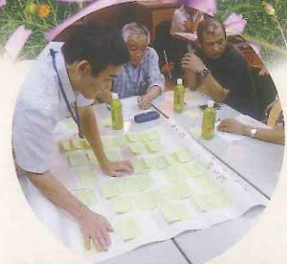
木太町夢えがきワークショップ