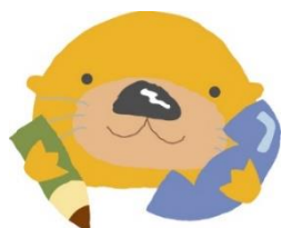
高松市子育てマスコット 「らっこ」