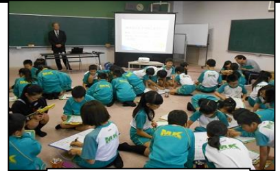
班で話し合う児童

最後に授業を受けての感想を聞くと、「自分だけは大丈夫と思わず、素早い行動を心がけたい」や「普段から家族で防災について話し合いをし、避難場所についてきちんと決めておきたい」という意見が出た。どの児童も防災への関心が高まったと言える。