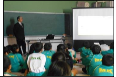
解説編を食い入るように見る児童